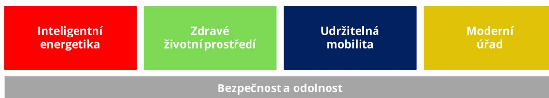
Obrázek 3 Pilíře Smart City rozvoje

Pro potřeby Strategie Smart City města Uherské Hradiště byly na základě výsledků analytické části, identifikovaných potřeb města a ve spolupráci s projektovým týmem stanoveny následující 4+1 pilíře rozvoje chytrého města , pro které jsou následně definovány jednotlivé strategické a specifické cíle Strategie Smart City: