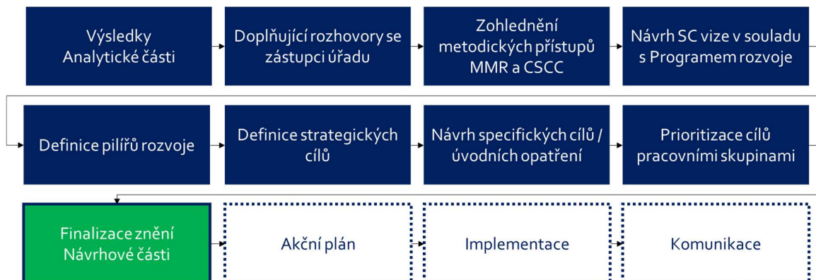
Obrázek 2 Proces vytváření Návrhové části Strategie a další postup