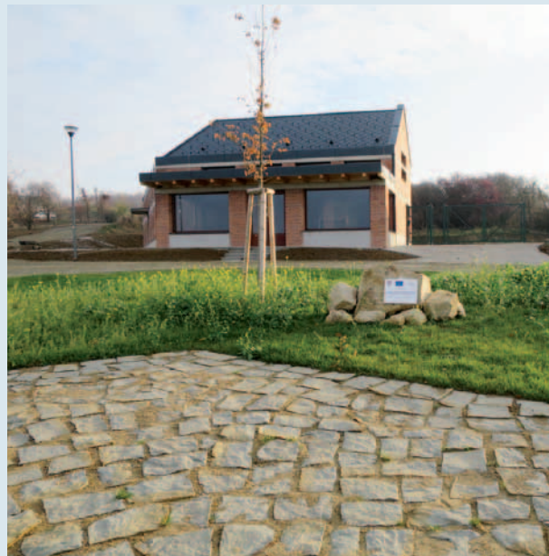
Přírodní amfiteátr Parku Rochus