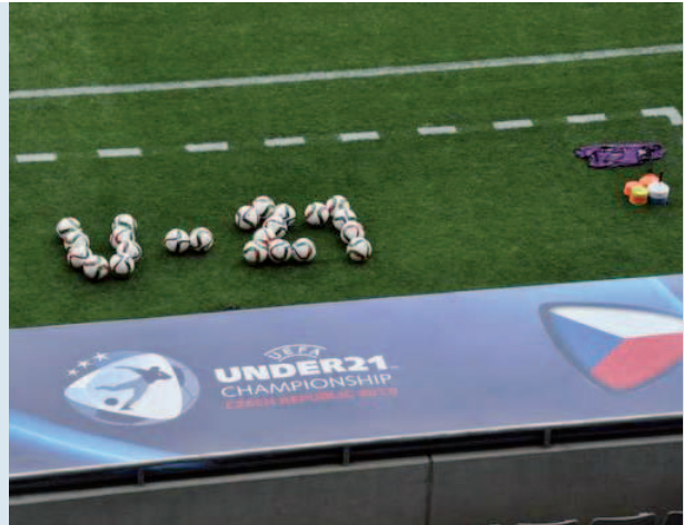
Mistrovství Evropy ve fotbale hráčů do 21 let.