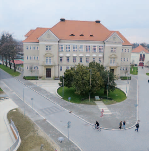
Revitalizace veř. prostranství náměstí Komenského až Jezuitská kolej