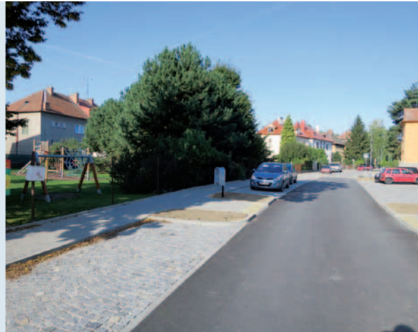
Rekonstrukce komunikace ulice Jana Žižky