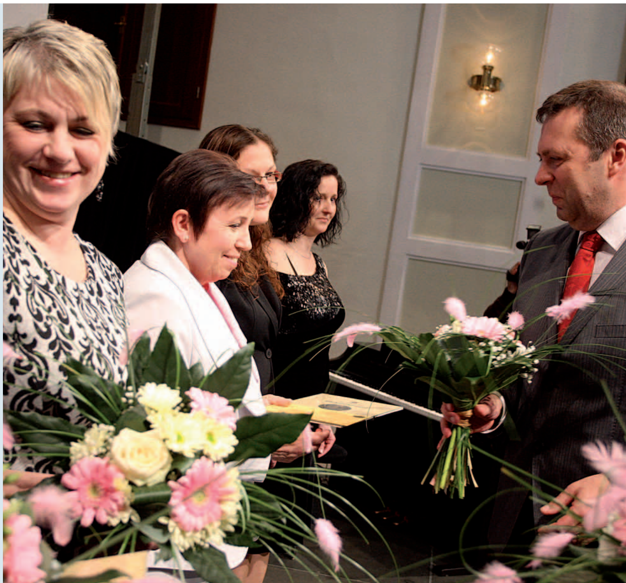
Ocenění pedagogů v roce 2015