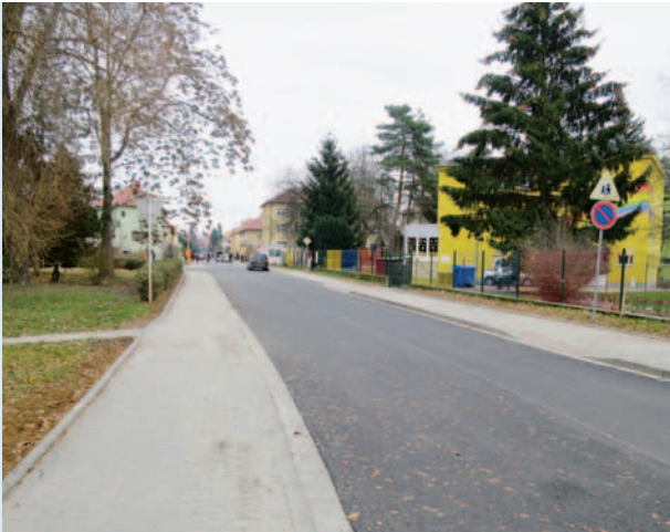
Bezbariérový chodník ulice Husova