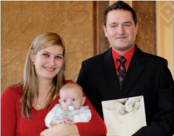
První narozené dítě v roce 2015