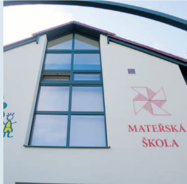
Zateplení MŠ Lomená