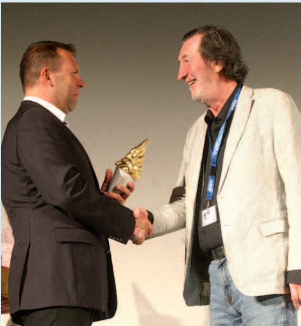
41. Letní filmová škola