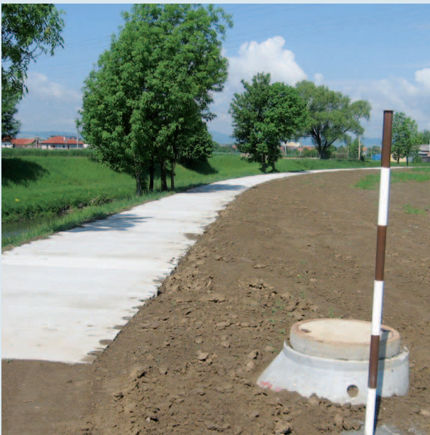
Převedení odpadních vod z místní části Vésky a Míkovice na COV Uherské Hradiště