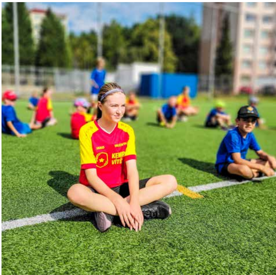
Kemp vítězů uvítá děti od 1. třídy základních škol až do 15 let.

Právě na individuálním přístupu si organizátoři kempu zakládají,