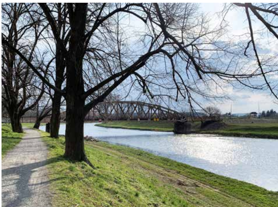
Cesta podél Moravy k železničnímu mostu.