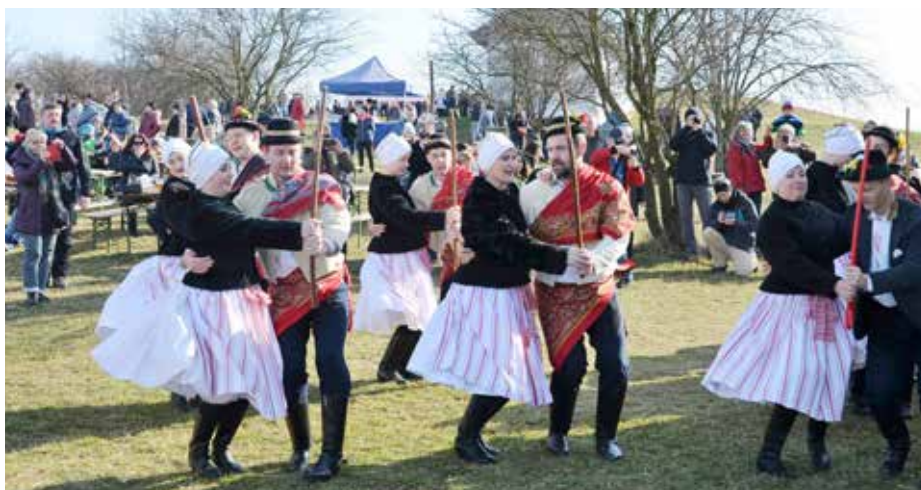
Kulturní programy na Rochusu se přesunou do nového amfiteátru.

navazuje na hlavní příjezdovou cestu do areálu, zřízení kabelové přípojky a vybudování osvětlení přístupu a prostoru amfiteátru. Provedeny budou i přípravné sadovnické práce, které jsou zaměřeny na dočištění území od staré nežádoucí vegetace, srovnání menších povrchových nerovností a konečné výsadbové práce na parkových plochách v okolí amfiteátru. Práce si vyžádají celkové náklady přesahující 10,7 milionu. Do konce července by pak měla vzniknout samotná zpevněná plocha pro pódium, dvě schodiště, plošiny pro lavice k sezení a mobilní pódium. „V plánu je, že samotný amfiteátr by měl být z části přírodní – návštěvníci budou sedět na zatravněné ploše, v části hlediště pak bude k sezení využito mobilních dřevěných lavic, které budou uskladněny v blízkém objektu Parku Rochus. Předpokládaná kapacita amfiteátru je asi 400 míst,“ prozradila místostarostka Čechová. Akce je součástí projektu přeshraniční spolupráce programu Interreg Slovenská republika-Česká republika.