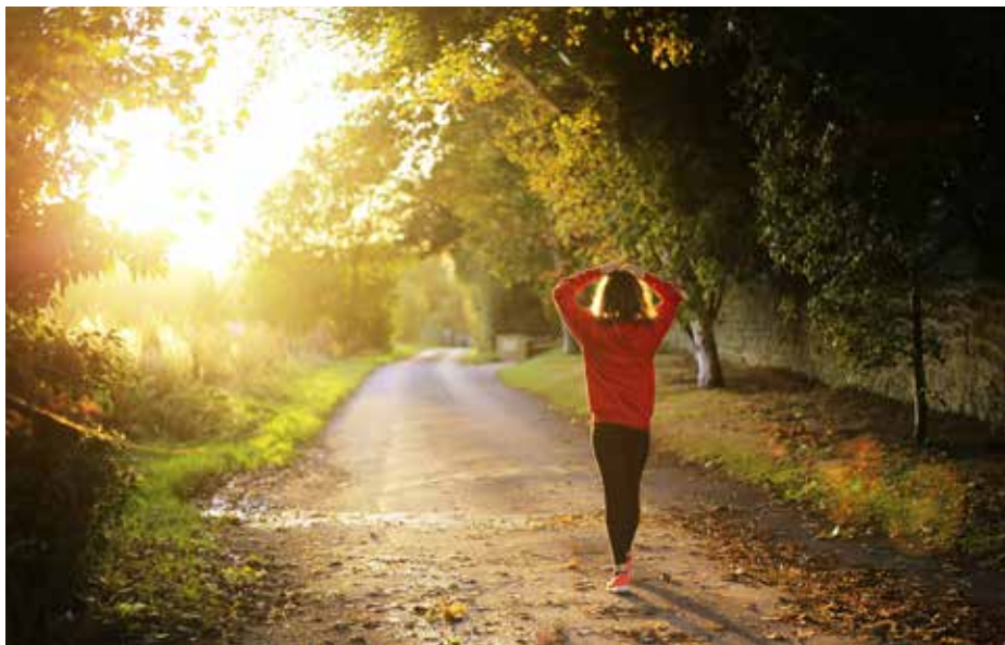
Chůze je přirozený a zdravý pohyb.

Zaregistrujete se a 1. dubna můžete začít. Svou aktivitu můžete v rámci výzvy monitorovat na jakémkoliv zařízení a následně ji nahrát v podobě printscreenu do svého profilu. Účastníci výzvy mohou využít také mobilní aplikaci k tomu určenou. Každý kilometr je bodově ohodnocen, přičemž je zohledněn věk účastníka a jeho BMI. Snahou je umožnit umístění na prvních místech „výkonnostního“ žebříčku i starším lidem a lidem s vysokým BMI.