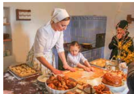
Co se jedlo o fašanku a Velikonocích? Ochutnejte ve skanzenu.

Hledáme nové spolupracovníky na pozice průvodců, lektorů výukových programů a spoluorganizátorů akcí v našem muzeu. Jste komunikativní, spolehliví a vždy s úsměvem na tváři? Zajímáte se o folklor nebo historii a trávíte rádi čas v přírodě? Tak se přidejte do týmu společnosti Parku Rochus! Nabízíme práci na dohodu v krásném prostředí přírodního parku a muzea v přírodě s výhledem do slovácké krajiny.