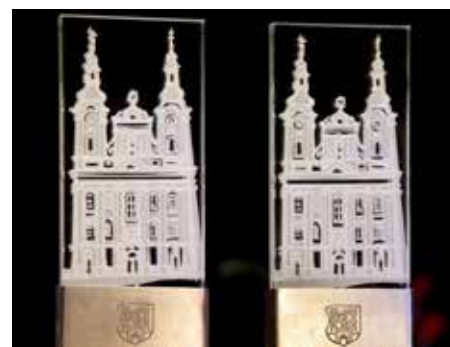
Pamětní plakety, které získávají držitelé ceny města.

Součástí návrhu musí být také zdůvodnění, za co je jmenovaný na ocenění nominován. Vloni byli Cenou města oceněni folkloristka Štěpánka Tománková a zkušební pilot Stanislav Sklenář. Cena města Uherské Hradiště je udělována Zastupitelstvem města Uherské Hradiště jednou ročně za podstatný přínos pro město Uherské Hradiště. Uděluje se zpětně za předchozí rok.