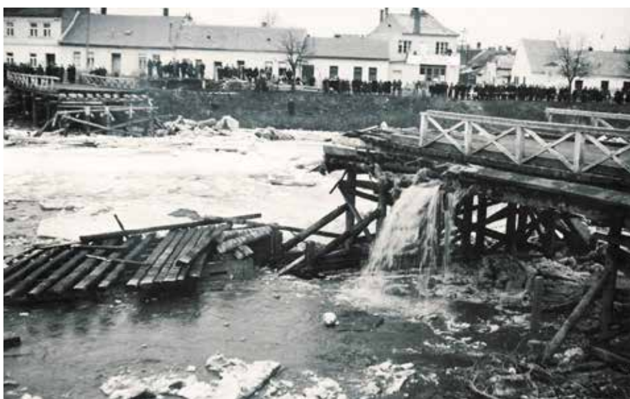
Most stržený povodní 5. 2. 1946.

V roce 1948 bylo započato s přípravou na vybudování nového mostu. Jeho návrh se vyhnul střednímu pilíři v řece Moravě, nový most má tři pole podpírané dvěma pilíři, délka přemostění je cca 102 metrů. Požadavkem města Uherské Hradiště při jeho projektování bylo vybudování lávky pro pěší, město bylo jejím investorem a ujalo se její správy. Ocel pro most vyrobily Vítkovice železářny Klementa Gottwalda, n. p., výrobu