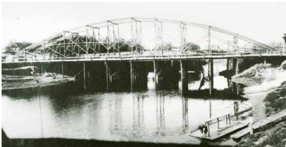
Stavba silničního mostu přes řeku Moravu, 1905.

Nejdůležitějším byl most přes řeku Moravu, který byl ve středověku i raném novověku součástí významné obchodní cesty z Uher. Původně byl umístěn naproti Staroměstské brány, která stála na konci dnešní Vodní ulice. Při budování barokního opevnění v 17. století byl posunut proti proudu do míst, kde dnes končí ulice U Brány.