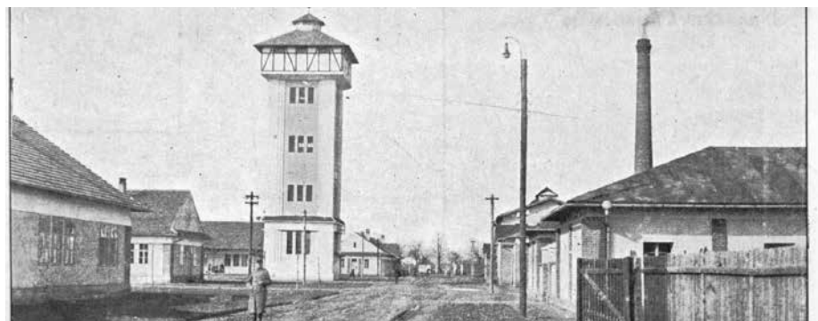
Sanitní tábor s infekční nemocnicí.

Zemská nemocnice v Uherském Hradišti zahájila svou činnost k 15. lednu 1924, kdy také obdržela č. p. 365.