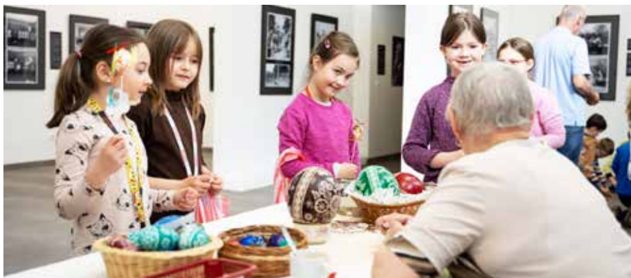
V muzeu se návštěvníci seznámí s různými technikami zdobení kraslic.