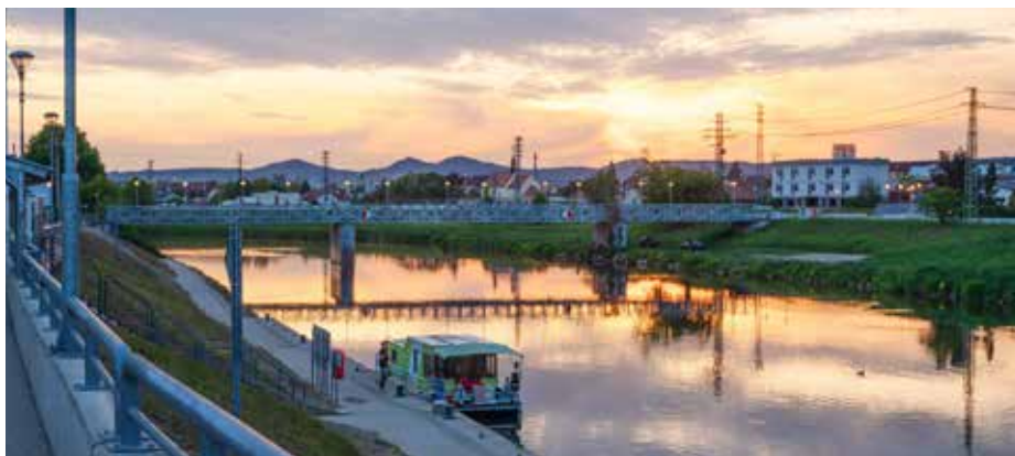
Lávka pro pěší a přístaviště na řece Moravě.

Voda patří k městu. Projděte se a poznejte uherskohradištské mosty