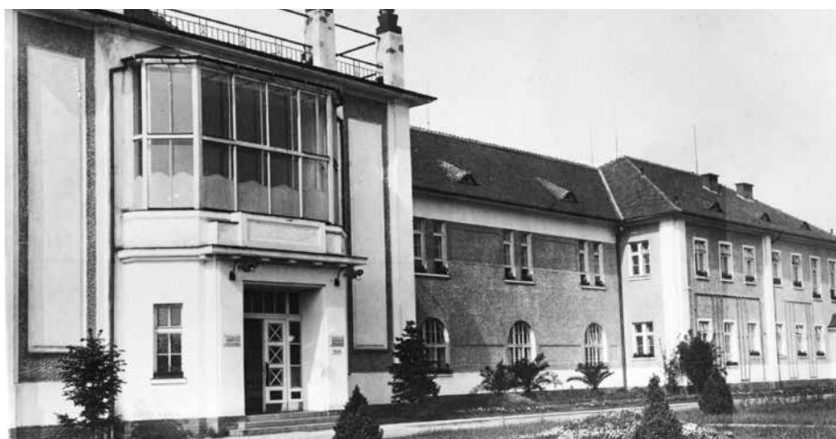
Hlavní chirurgický pavilon nemocnice, 1924.