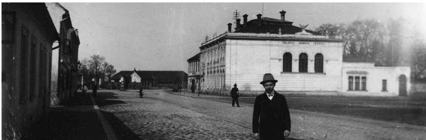
Pohled na starou sokolovnu s hotelem Koruna ve 20. letech 20. století.