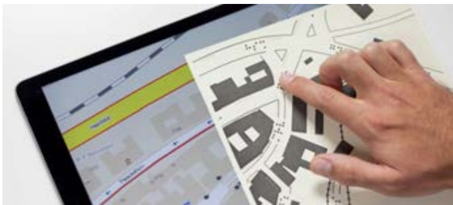
Haptická mapa pro nevidomé.

V Uherském Hradišti sídlí organizace SONS (Sjednocená organizace nevidomých a slabozrakých ČR), která má pro nevidomé a slabozraké k dispozici haptickou mapu Uherského Hradiště. V Informačním centru pro mládež tuto nabídku obohatí ještě mapa historického středu města s popisem historických budov a mapa města z roku 1670.