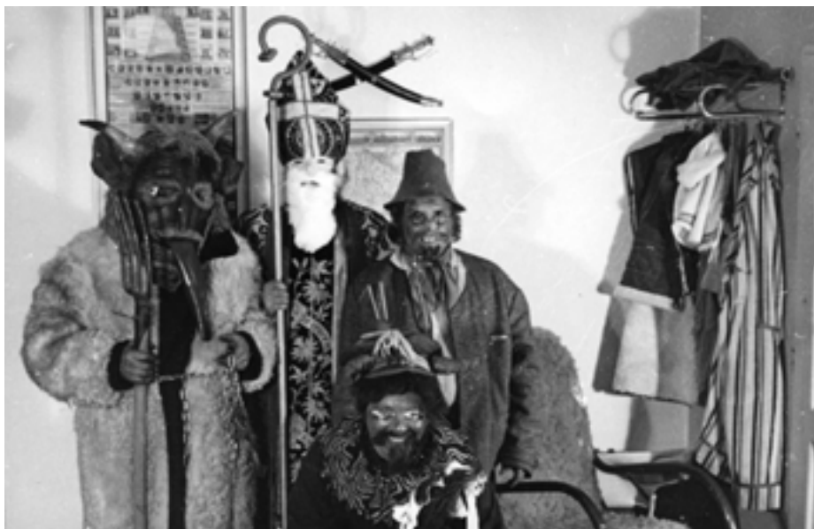
Masky Mikuláše a čertů, Uherské Hradiště, 1966.