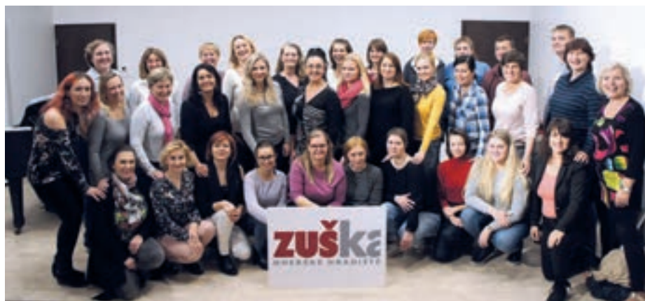
Bývalé členky a členové sboru se sešli při společných zkouškách před velkým koncertem k jubileu.