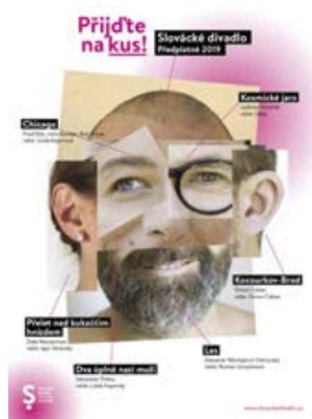
Nový plakát z dílny grafika Davida Zezuly.

zakoupit přímo v pokladně divadla nebo online na webových stránkách, kde naleznou také kompletní informace o jednotlivých titulech. -BŠ-