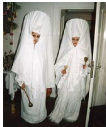
Masky lucek z Kunovic, rok 2003.