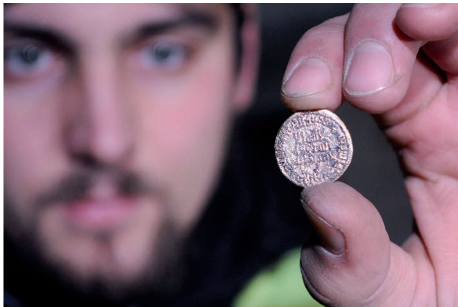
Arabský dirham nalezený pod domem Základní umělecké školy na Mariánském náměstí

Napadlo mě, zda ono město nebylo předchůdcem Veligradu, ale hned jsem tu myšlenku zavrhl, protože historikové by se na mě vrhli, že takové tvrzení nemohu dokázat. „No, zatím ne, ale ta mince něco naznačuje,“ chce se mi říci, ale raději mlčím. Mince je jediný náález tohoto druhu v České republice, tedy v prostoru, kde se nalézalo centrum Velké Moravy. Jen v Bratislavě se podobná kdysi našla, nicméně řekněme si, že náález platidel v centrech podél Dunaje, který byl od pradávna významnou obchodní cestou, se dá fakticky očekávat. A mně dál vrtá hlavou, proč se asi vydal majitel té mince „pustinami a územím bez cest, s vodními prameny a hustými lesy“ až na jakýsi ostrov v řece Moravě?