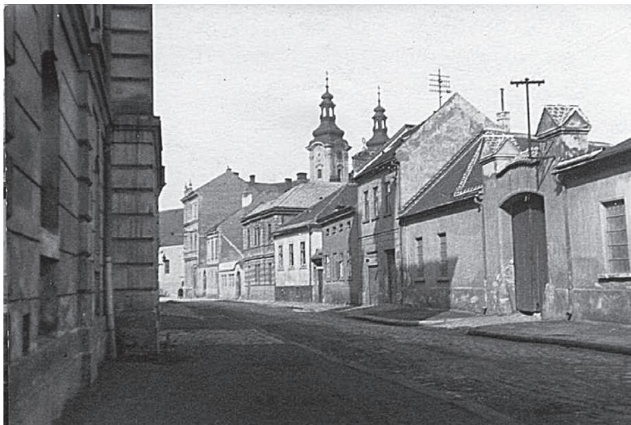
Hradební ulice ve 30. letech 20. století, vpravo domy na místě dnešní pošty.