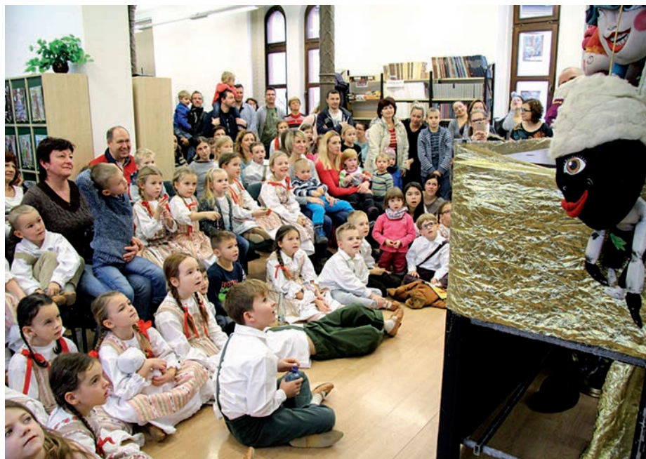
Ohlédnutí za 11. ročníkem Dne pro dětskou knihu