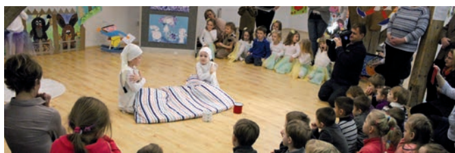
Výstava výtvarných prací dětí z více než 20 mateřských škol Uherskohradištska byla zahájena 7. 12. a potrvá do 31. 1. 2018. Děti z MŠ Komenského si na úvod připravily velice podařené a veselé vystoupení inspirované oblíbenými večerničky.