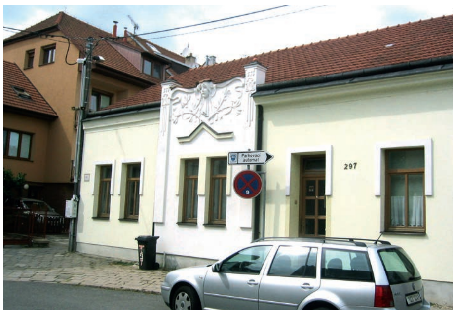
Dům čp. 297 v Žerotínově ulici.