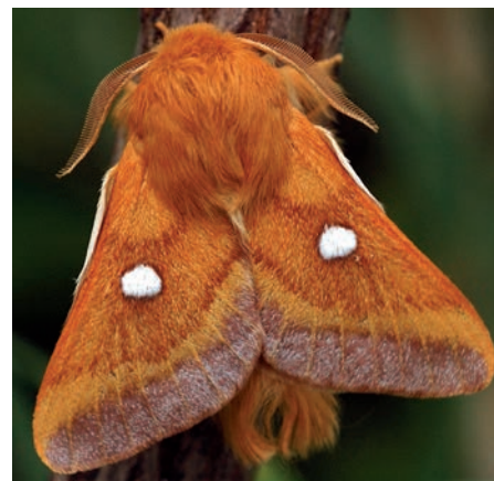
Bourovec trnkový – silně ohrožený noční motýl, hlavní předmět ochrany v lokalitě Rochus.

Bývalý vojenský výcvikový prostor je velmi zajímavou přírodní lokalitou. Dřívější pojezdy těžké vojenské