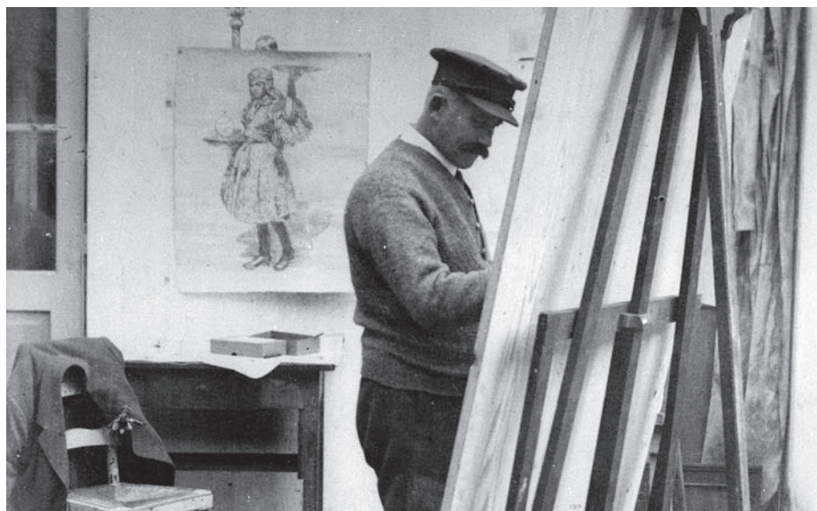
Joža Uprka při malování plakátu k výstavě a otevření Slováckého muzea v roce 1914.