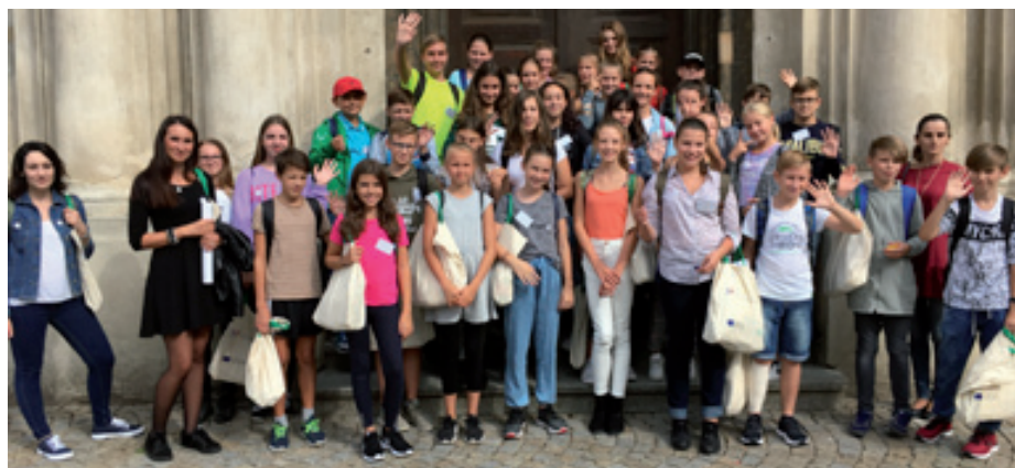
Sedmáci ze Základní školy UNESCO na návštěvě ve Skalici.

Ještě před koncem školního roku nám skalické děti návštěvu oplátí a my už se těšíme, až jim budeme moci v rámci projektu Poznej své družebné mesto Uherské Hradište představit i naše královské město. - HH, BJ -