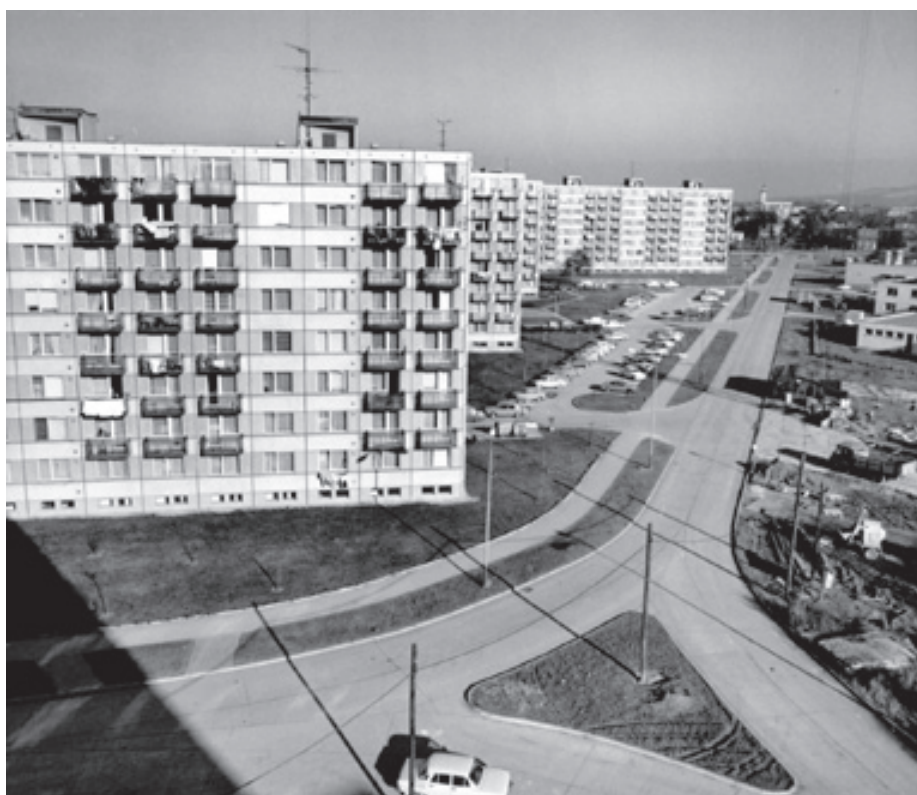
Sedmdesátá léta. Pohled na čerstvě dokončenou ulici Štěpnickou s bloky I. až IV.

Tehdejší panelová technologie upřednostnila dlouhé bloky, mezi nimiž nescházela ani dětská hřiště a parkovací místa. Noví obyvatelé