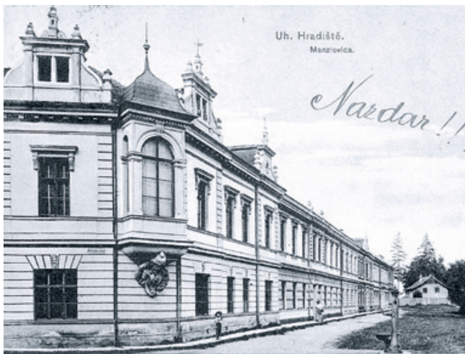
Ulice Jana Lucemburského na pohlednici z počátku 20. století. V pozadí pravděpodobně bývalá pevnostní prachárna.