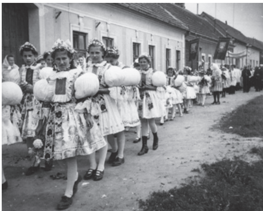
Slavnost Božího těla. Průvod krojovaných děvčat, mužů s korouhvemi a baldachýnem ve Starém Městě. Rok 1953.

Druhým impulzem byl zázrak v italském městě Bolsena. Během mše svatě zde údajně při proměňování hostie v tělo Kristovo ulpěla skutečná kapka krve na tkanině pod kalichem. Zázrak byl přezkoumán papežem Urbanem IV. v roce 1263 a následujícího roku 1264 byl svátek Božího těla ustanoven papežskou bulou.