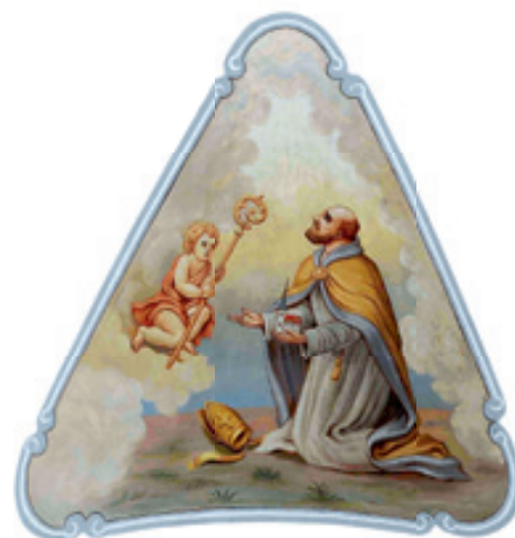
Freska na klenbě presbytáře františkánského kostela zachycuje idealizovanou podobu Jana Filipce.