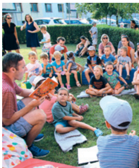
Ohlédnutí za loňskými čtenými večerníčky u knihovny.

Malý festival k podpoře dětského čtení Hradištské sluníčko letos proběhne v týdnu 17. až 21. června. Festival nabízí pořady, které během týdne rozsvítí prostory naší knihovny. Chce pozvat děti, které zůstávají přes léto ve městě,