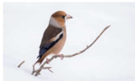
Grossman Martin, 2. cena v TO A, Dlask tlustozobý

ale zejména negativní dopady lidského konání na naše okolí a přírodu, to vše je na snímcích zachyceno. Vítězná kolekce fotosoutěže bude k vidění v prostorách Reduty do 20. července. - PB -