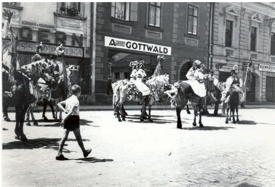
Vlčnovská jízda králů na Mariánském náměstí, 1930.