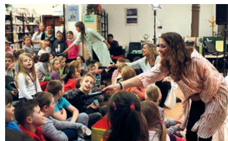
Herečky z divadla MALÉHRŮ to s dětmi opravdu umí!

Pohádkový večer vyvrcholil společně zazpívanou gratulací a společným fotografováním. To největší dobrodružství ale na všechny děti čekalo až v noci: soutěže, stezky odvahy, noční procházka, a hlavně čtení pohádek – to všechno nebralo konce. Tak zase za rok!