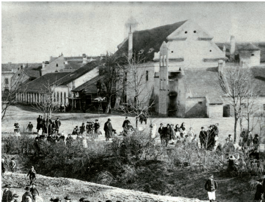
Prostor dnešní Milíčovy a Blahoslavovy ulice v roce 1904.