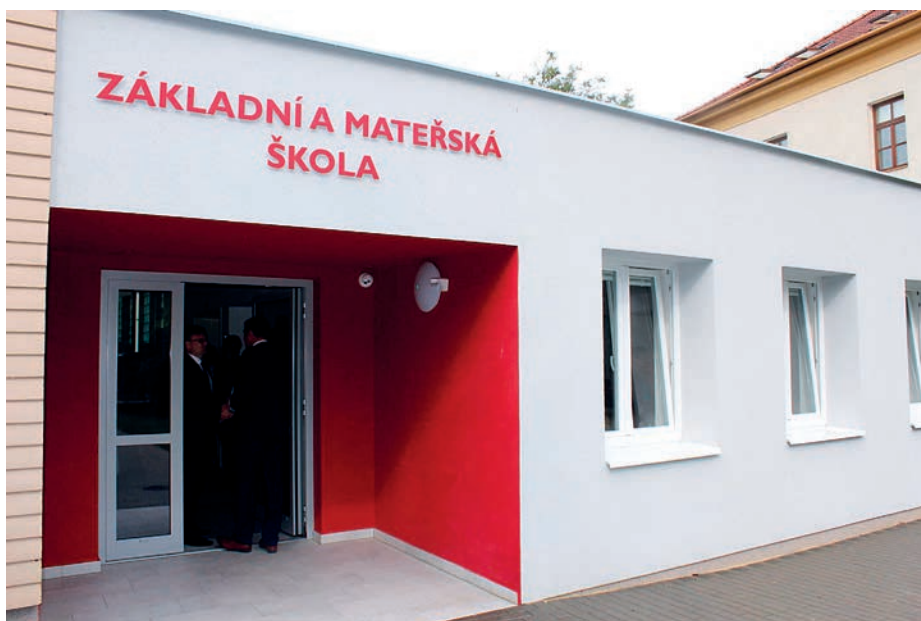
Budova speciální školy na Šafaříkově ulici již prokoukla, letos se bude investovat především do škol zřizovaných městem.

Na konci loňského roku schválilo zastupitelstvo rozpočet na letošní rok. Je postaven tak, že celkové příjmy jsou 687 milionů korun, plánované výdaje dosahují 836 milionu. Na kapitálové výdaje je pro tento rok určeno 238,4 milionů korun a město plánuje velkou investiční aktivitu. Podívali jsme se blíže na to, co z toho vyplývá pro jeho obyvatele.