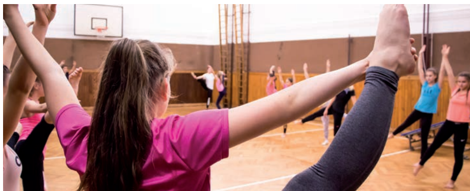
Starší zákyň a dorostenky ve cvičební hodině.

Nejlepší cvičenky připravují cvičitelé každoročně na závody všestrannosti v gymnastice, atletice, plavání a šplhu (letos přivezli hradištské sokolové z celostátního kola dvě stříbrné medaile v kategorii dorostenek a starších zákyň). S družstvem TeamGymu se účastní soutěží v akrobacii, malé trampolíně a soutěží také s pódiovou skladbou. Z celostátního kola této soutěže přivezl starší TeamGym v lednu 2018 bronz.