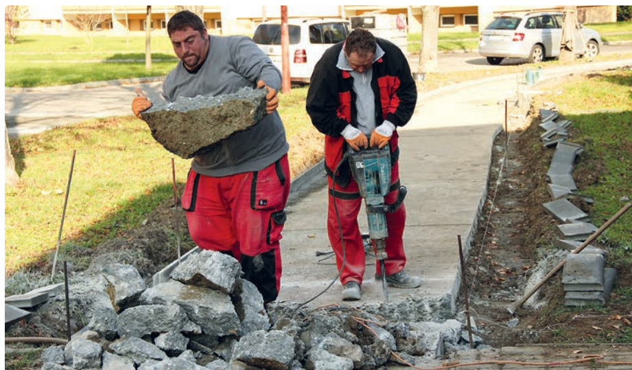
V roce 2019 pokračují opravy chodníků.