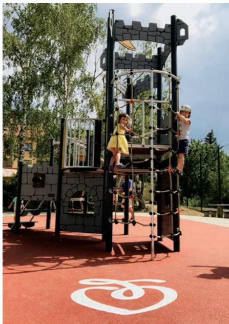
Novou dominantou hřiště Na Splávku je hrad pro malé lezce. Letos se modernizují další hřiště.

Množství akcí na rok 2019 či s přesahem do roku 2020 chystá také odbor správy majetku města.