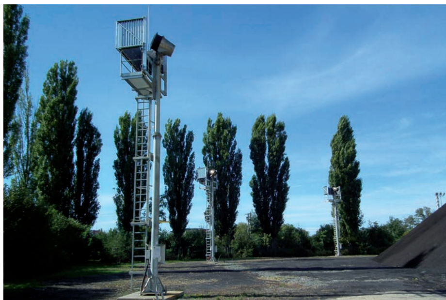
Takzvaná mlžná stěna, kterou nechala nainstalovat společnost CTZ v areálu teplárny, podle obyvatel z okolí k výraznějšímu snížení prašnosti nepřispěla.