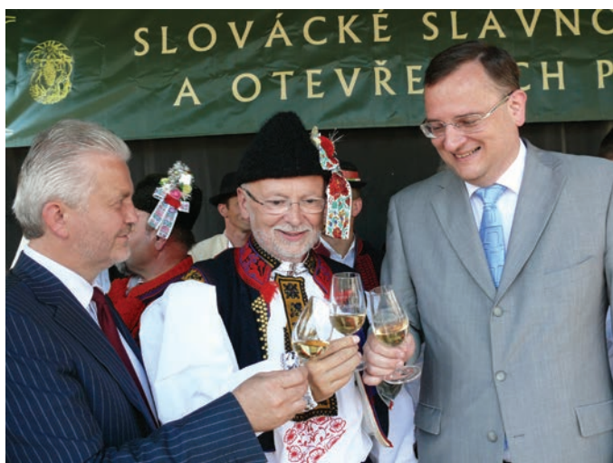
Květoslav Tichavský jako starosta města na Slováckých slavnostech vína a otevřených památek v roce 2012, společně s tehdejším premiérem Petrem Nečasem, rodákem z Uherského Hradiště, a bývalým hejtnanem Liborem Lukášem.