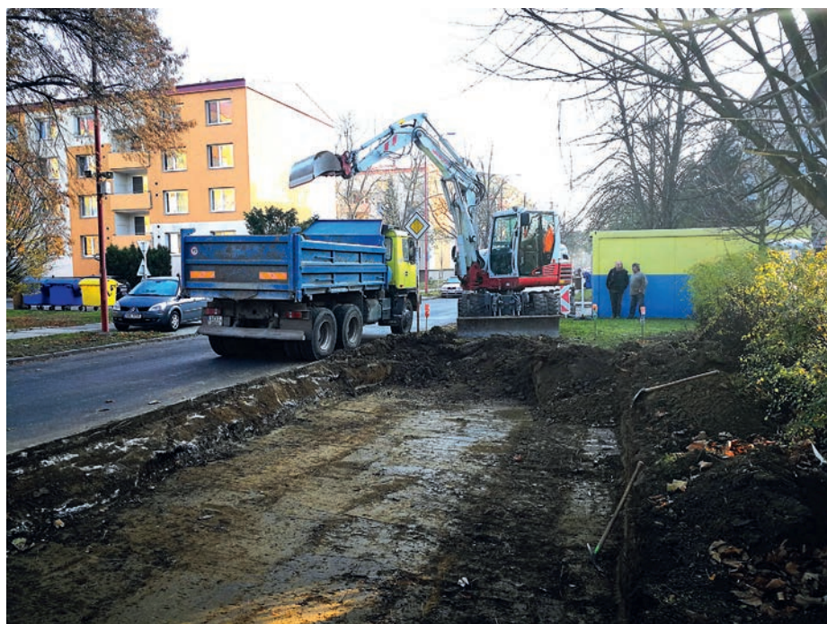
Výstavba nových parkovacích míst na sídlišti Štěpnice je v plném proudu.

rekonstrukce svou druhou etapou za přibližně 18 milionů, uskutečnit by se měla také druhá etapa revitalizace sídliště 28. října za 16,4 milionu. Dalších 10 milionů korun bude stát vznik autobusových zastávek na ulicích Sokolovská (příprava projektové dokumentace), Malinovského, ve