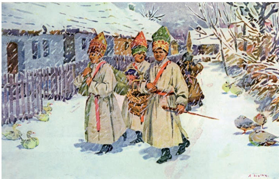
Tříkrálová obchůzka z Veselí nad Moravou zachycená malířem Antošem Frolkou v roce 1910.

Do liturgie svátku spadá žehnání vody, soli, kadidla a křídly, kterým lidé přikládali zvláštní sílu. Svěcená křída nebo voda se přidávala do léčebných medikamentů i odvarů. Tříkrálovou vodou se vykropoval dům, dvůr, hospodářské budovy, pole i vinice, uschovávala se pro různé potřeby v kropence. Bylo zvykem nalít jí trochu do studny, aby v ní byl