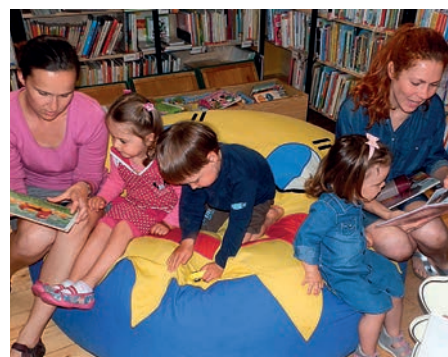
Jedno z prvních setkání s nejmenšími v rámci projektu Bookstart.