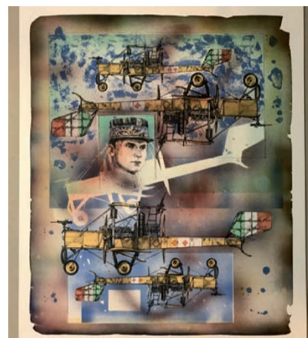
Letem světem – litografia Homage to Štefánik 2018.