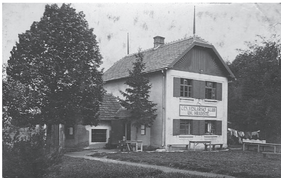
Budova veslařského klubu postavená v roce 1927.