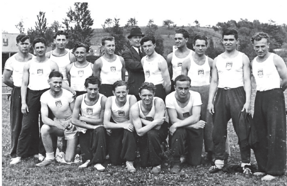
Atleti AC Slovácká Slavia na národních hrách ve Zlíně v roce 1942.

Sport a tělovýchova má v Uherském Hradišti dlouhou a bohatou tradici. Jejich kapitoly začal psát již v roce 1863 německý veslařský spolek Ruderverein, důležitým mezníkem v historii hradištského sportu se však stal Sokol (1872), na nějž začala postupně navazovat další sportovní odvětví. Z nich jmenujme Klub českých turistů (1896), Klub českých velopedistů (1897), Kroužek hráčů tenisu (1901) a jiné. Významnou roli ve sportovním životě města pak sehrál vznik Českého sportovního klubu v roce 1904 a posléze i Českého veslařského klubu (1908), u jejichž zrodu stáli především studenti zdejšího gymnázia. Oba kluby se sice staly nositeli organizované sportovní činnosti na území města, v ní však upřednostňovaly jen některé druhy sportu.