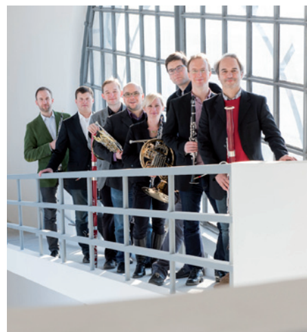
Cyklus Musica: Philharmonia Octet, 8. 12. v Redutě