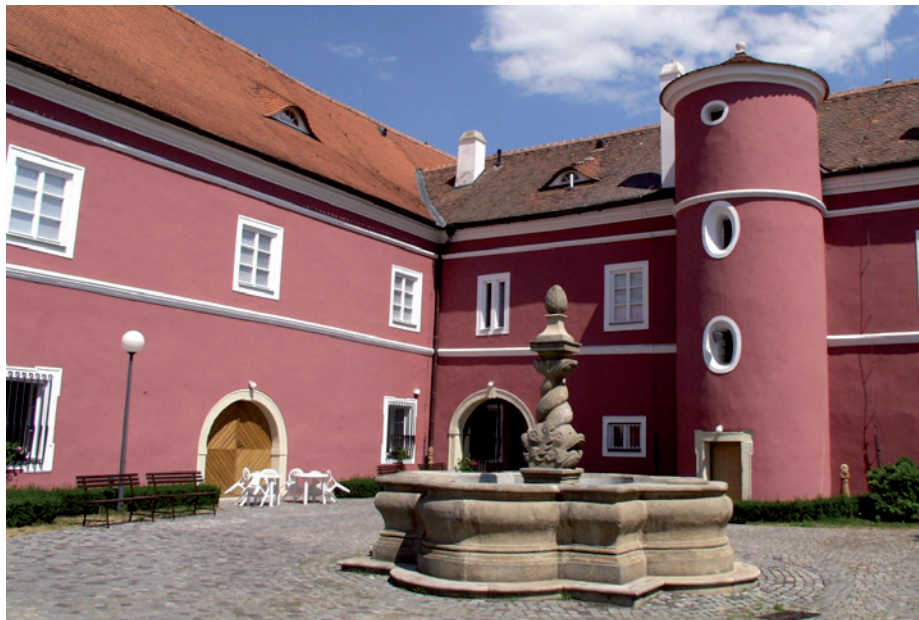
Originál barokní kašny z Masarykova náměstí najdete na nádvoří Galerie Slováckého muzea.