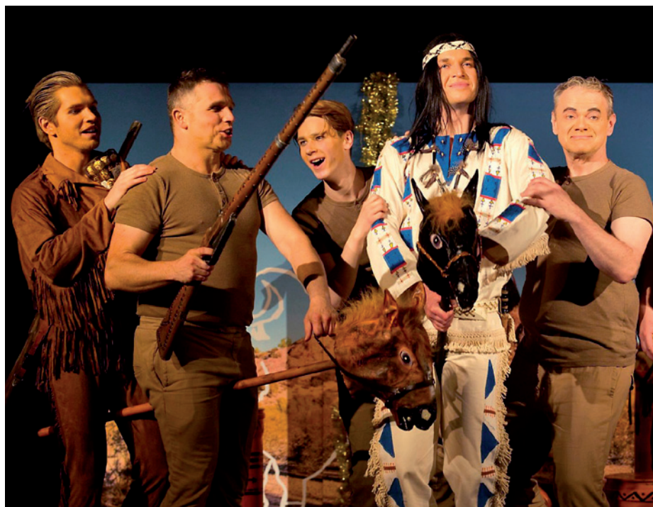
Divadlo Pecka zahraje 2. července na Koruně představení Vinetůůů!

Z původního hotelu byla v dalších desetiletích v provozu jen restaurace se zahradní restaurací a v 80. letech byla i ta uzavřena. Znovu zprovozněna byla v devadesátých letech, ale později opět uzavřena. Od roku 2018 ji převzal nynější provozovatel Michal Bábovský. Od podzimu plánuje otevřít i vnitřní prostory restaurace. Více na facebooku Koruna - letní zahrádka. - RED -