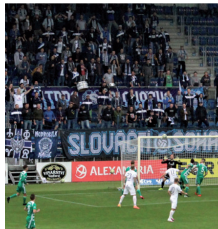
„Kotel“ s napětím sleduje, jak míč při utkání s Bohemians končí pouze na břevně.

Než dostanete do rukou Zpravodaj, bude mít Slovácko v nadstavbě za sebou 21. a 27. června semifinále bojů o Evropu s Bohemians. Vítěz se pak utká 4. a 7. července s lepším z duelu České Budějovice–Mladá Boleslav. Kvalifikace o Evropskou ligu pak proběhne 12. července. - MP -