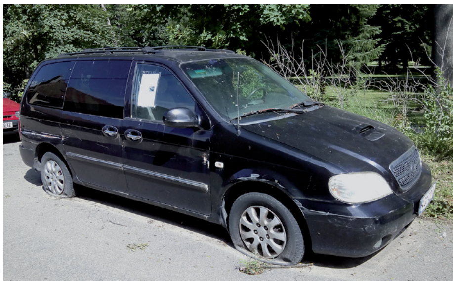
Nepojízdný automobil Kia v ulici U Stadionu.

Nepodaří-li se vlastníku pozemní komunikace zjistit potřebné identifikační znaky vozidla, je město oprávněno požádat silniční správní úřad o otevření a ohledání vozidla.