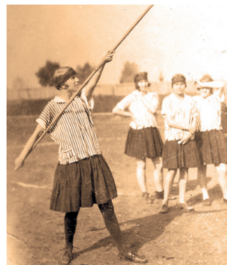
Atletické závody v Přerově v roce 1924.