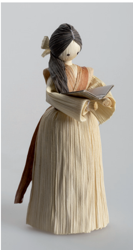
Oblíbené panenky z kukuřičného šustí se začaly vyrábět až v padesátých letech 20. století.