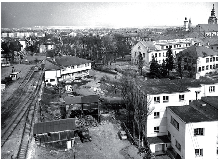
Pohled na areál bývalého Slováckého hospodářského družstva v roce 1971.

Na pozemcích u nádraží v roce 1921 postavilo skladiště s vlečkou Slovácké družstvo hospodářské, založené roku 1916, a postupně rozšířilo svůj areál až k ulici Jiřího z Poděbrad, když v letech 1929–1930 vybuvovalo administrativní budovu a v letech 1931–1932 moderní