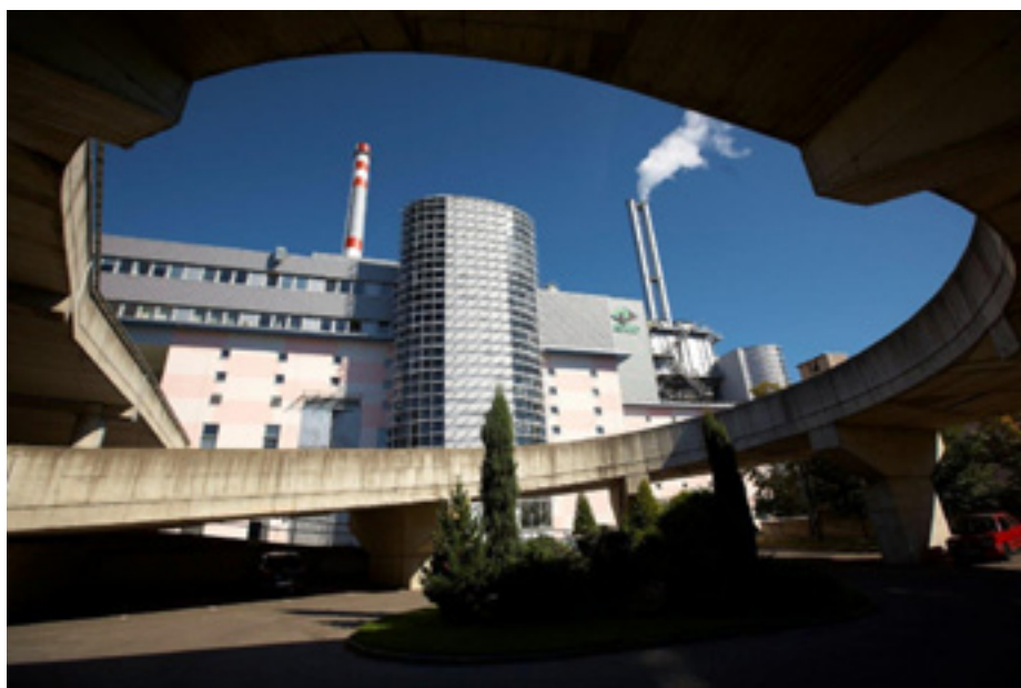
Zařízení na energetické využití odpadu Termizo v Liberci.

Zápachové zkoušky byla podrobena i spalovna komunálního odpadu Termizo v Liberci. Ukázalo se, že bezprostředně před otevřenými vraty, kterými jsou do bunkru shazovány odpadky, cítíte to samé, jako když otevřete víko týden nevyvezené hnědé