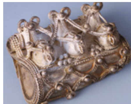
Stříbrná středohradištní kaptorga z Kouřimi

Panelová výstava zaměřená na významné lokality doby velkomoravské ve středních a severozápadních Čechách podhaluje historické dění i významné mocenské kontakty tehdejší doby. PhDr. Naďa Profantová, CSc., z Archeologického ústavu Akademie věd ČR v ní přibližuje centra raně středověkých Čech, která se vážou k době spolupráce Čech s Moravou za knížete Bořivoje i k době Svatoplukovy vlády v Čechách (889/90–894). Představuje například starobylé hradiště Stará Kouřim – jedno z největších českých hradišť s úzkými vazbami na prostředí Velké Moravy. Zpřístupnění ve čtvrtek 17. září, potrvá do 31. ledna 2021.