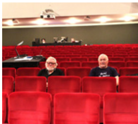
Koronavir vyprázdnil i hlediště Slováckého divadla.