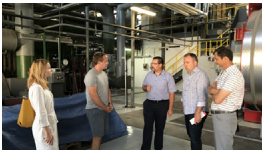
Zastupitelé při prohlídce technologie vsetínské teplárny.