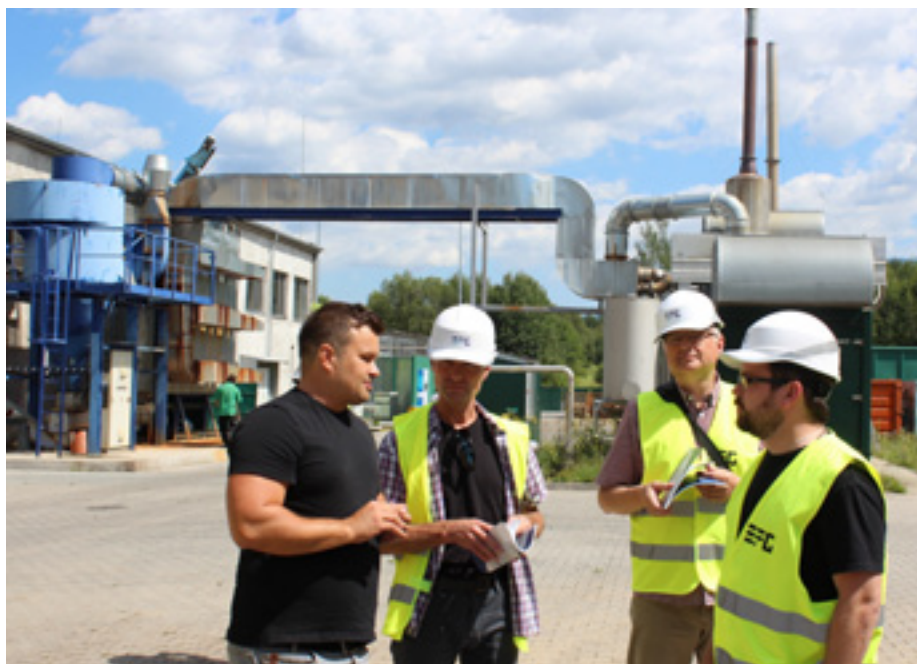
Bioplynová stanice v Rapotíně.