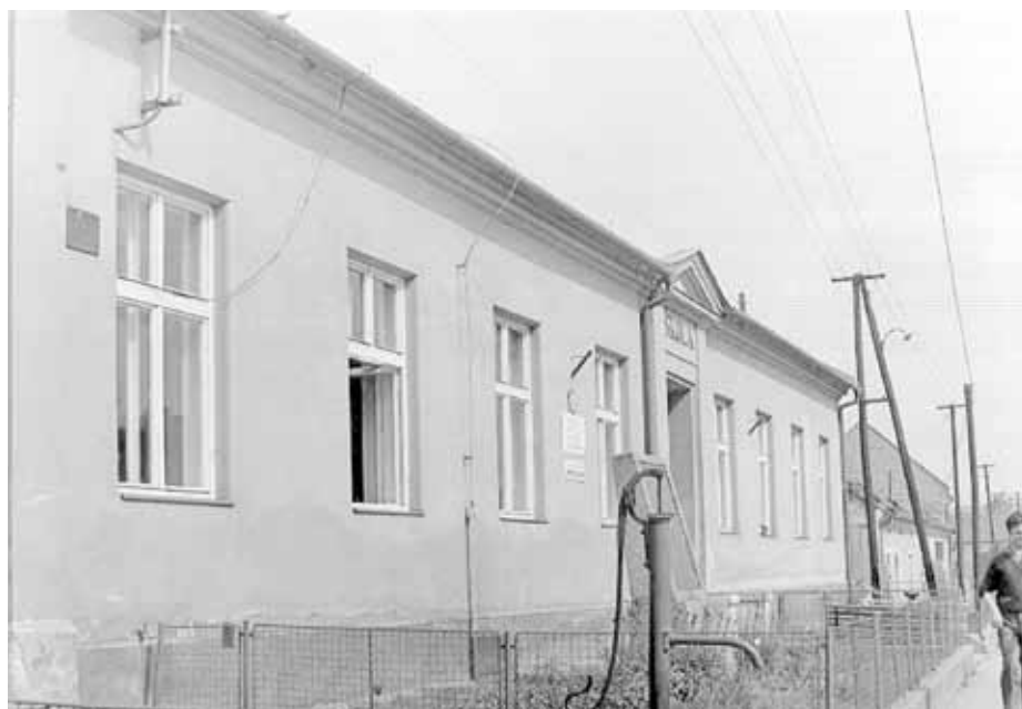
Pobočka Knihovny Bedřicha Beneše Buchlovana v Míkovcích na počátku 80. let minulého století. Byla umístěna v budově bývalé školy.