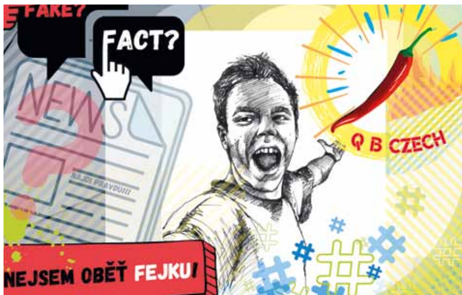
Plakát k výukovému programu.