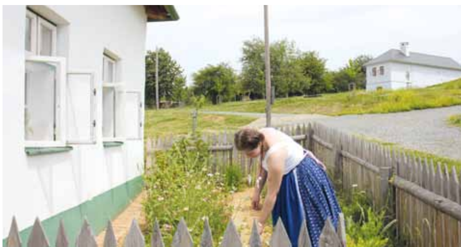
Nahlédněte do slováckých domků ve skanzenu Rochus.

Lidé na Slovácku si váží odkazu předků, snad i proto se zde podařilo