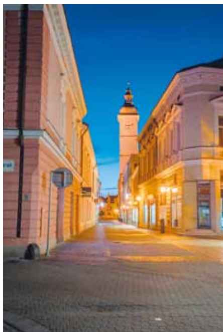
Šikmá věž radnice je od své osy vychýlená o 70 centimetrů.