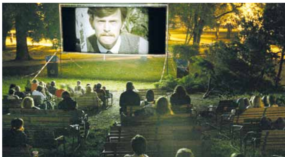
Otvírají se brány kin, startují i projekce pod otevřeným nebem.

Není nad výtečnou atmosféru projekcí pod širým nebem! Vláda uvolnila restriktce, takže nová sezóna letního kina (nejen) ve Smetanových sadech snad může proběhnout v plné síle. Vedle tradičního městského parku budeme promítat letos i na