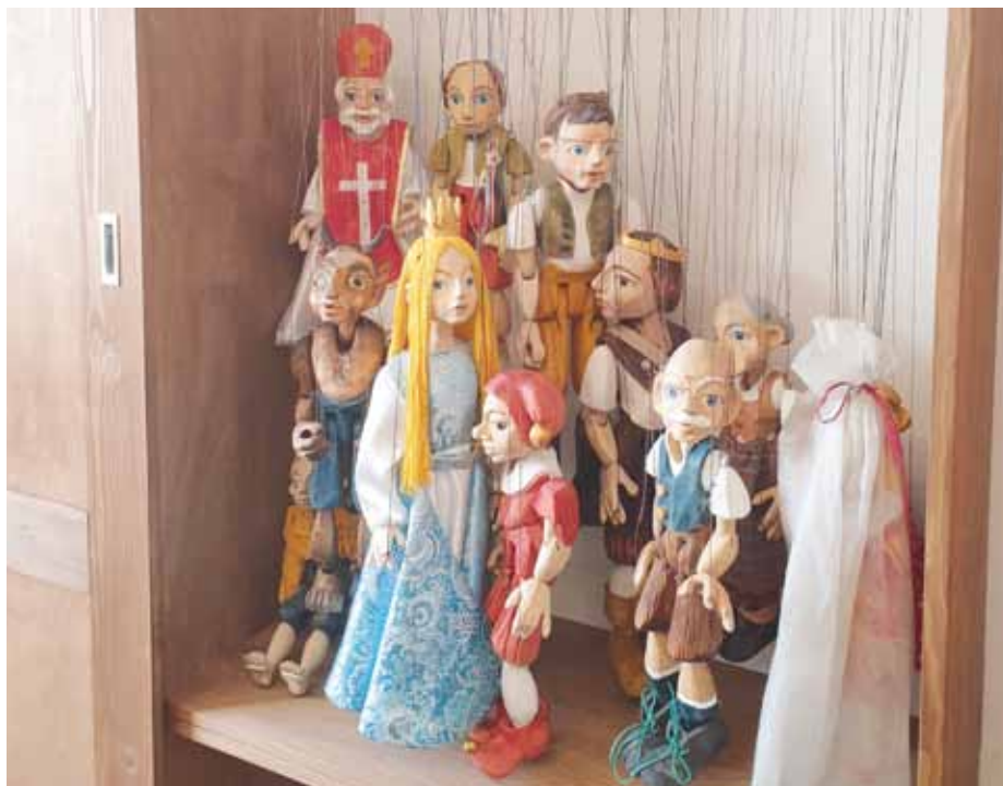
Loutky netrpělivě čekají na své diváky.

Dlouhou vynucenou dovolenou měly i loutkářské soubory Sokola. Přestávka v provozu loutkového divadla byla využita k velkému úklidu i k opravám. „Bylo třeba opravit elektroinstalaci, vymalovat, položit nové koberce a nechat na míru vyrobit skříně do zázemí pro herce i na uskladnění divadelního materiálu,“ vysvětluje starosta T.