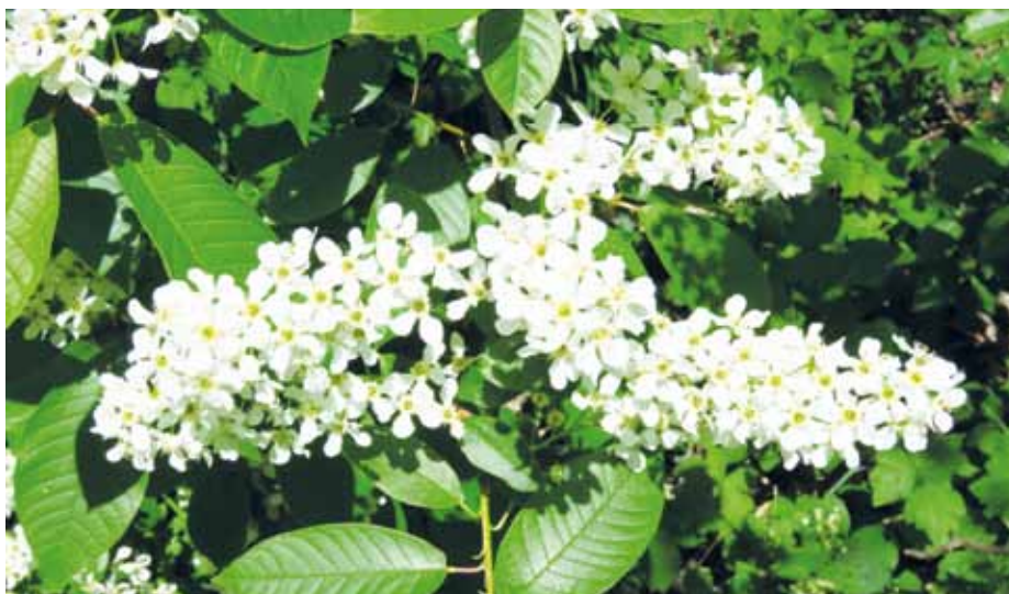
Střemcha obecná, Kunovský les.

Střemcha obecná má bílé kvítky a plodí trpké černé „třešničky“, které si oblíbili ptáci