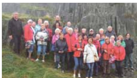
Členové A3V na jednom z výletů.

Vždycky, když jsme někde s Akademií přijeli na výlet, lidé se nejprve divili, co jsme za skupinu, a poté, že takto zorganizovanou pestrou možnost trávení volného času v Hradišti máme. Často říkali, že v jejich městě nic takového není. Jezdí k nám lidé i z Otrokovic, Bzence, z Veselí. Stojí jim to za to, zajímá je to, je to pro ně přínosem. V Akademii máme okruhy