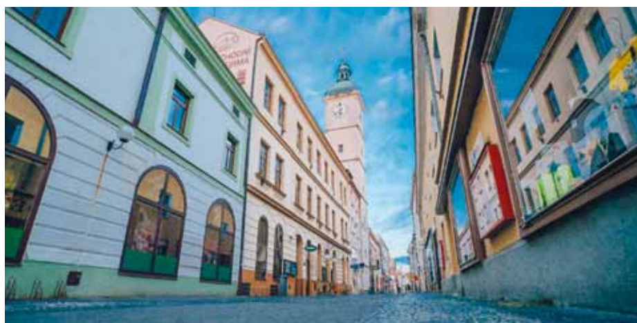
Pohled na věž radnice od Mariánského náměstí.

Bude třeba provést celkovou rekonstrukci střechy, lokální vyspravení fasády, u oken je nutná oprava, případně výměna poškozených okenních