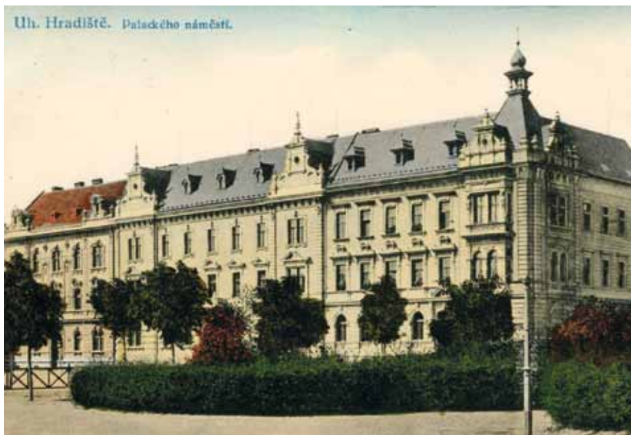
Domy č. p. 260, 231 a 238 na počátku 20. století.