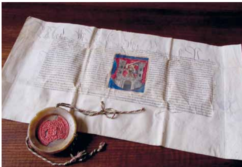
Znakové privilegium krále Matyáše Korvína.

Tento akt byl oceněním statečnosti měšťanů, kteří za česko-uherských válek ubránili město právě proti vojenské přesile uherského panovníka Matyáše Korvína a udrželi je pro českého krále Jiřího z Poděbrad i jeho nástupce Vladislava Jagellonce. Teprve po uzavření olomouckého míru Hradiště uznalo Matyáše za svého pána