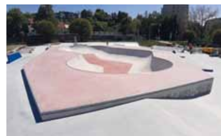
Skatepark je skoro hotov.

Uherskohradištský skatepark bude parádní. Těší se na něj nejen skateboardisté, ale i příznivci koloběžek, bruslí a kol, prostě všeho, na čem se dá ve speciálních betonových vanách jezdit a skákat. Monolit skateparku, který vyrůstá v jižním cípu venkovního areálu aquaparku, se už vyloupil do své takřka konečné podoby a v současnosti probíhají dokončovací práce včetně úpravy zpevněných ploch, umístění mobiliáře a informačního panelu. „Stavba probíhá podle plánu, dokonce v mírném předstihu, zhotovitel pracuje přesně podle našich představ. Plánujeme, že bude hotovo už začátkem června, kdy začne zkušební provoz a měření hluku z provozu skateparku,“ informoval místostarosta Jaroslav Zatloukal. Kdy se do skateparku budou moci vrhnout všichni fanoušci „prken“ a „koleček“, dáme včas vědět.