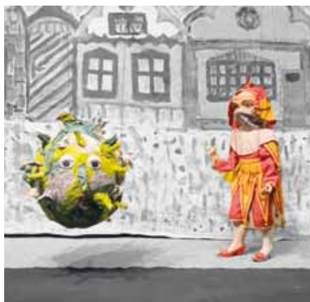
Viděli jste všechny díly loutkového online představení Kašpárek a koronavirus? Najdete je na youtube kanálu hradištského Sokola.

Za dlouhá desetiletí činnosti nashromáždil soubor obrovské množství kulis a vlastní více než stovku loutek. Jsou mezi nimi klasické dřevěné, více než sto let staré marionety s nádherně vyřezávanými