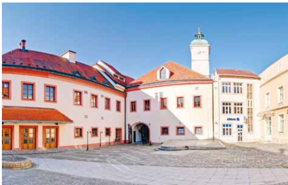
Pohled na nádvoří Staré radnice.

Z hlediska funkčního využití je v investičním záměru navrženo, aby v přízemí sídlilo Městské informační centrum, prodejna regionálních výrobků a kavárna. V patře by měla být situována Expozice dějin města Uherské Hradiště, expozice Tradiční rukodělné tvorby, Ceny Vladimíra