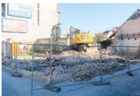
Demolice problematického domu v Rybárnách.

Město nechalo zdemolovat problematický rohový dům č. p. 53 v Šaňkově ulici v Rybárnách. Odstraněním ruiny domu se uvolňuje prostor, který bude součástí celého dopravního řešení dané lokality. Pro zlepšení dopravy v oblasti mostu přes řeku Moravu a v Rybárnách právě vzniká projektová dokumentace, jejíž zpracování zadalo město ke konci loňského roku. Stavba