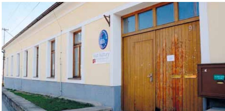
Kulturní zařízení v Mařaticích.

Místní kulturní zařízení v Mařaticích se potýká s mnoha problémy, které chce město vyřešit. Celkový stavební stav objektu je dlouhodobě neuspokojivý, největší starostí dělá pronikání vlhkosti do konstrukcí budov. Město chce vyřešit také propojení hlavního objektu se sociálním zařízením pomocí uzavřené komunikační chodby, přičemž samotné sociální zařízení bude spolu se všemi rozvody zrekonstruováno. Pro zlepšení