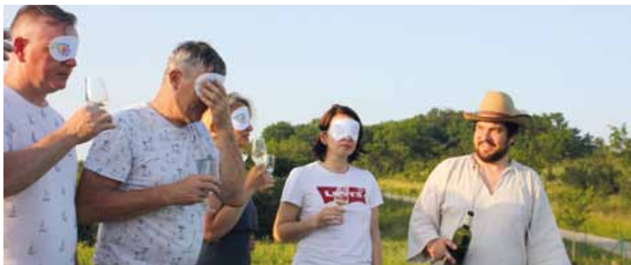
Oblíbený zážitkový košť vína poslepu.

O tajemnou podvečerní atmosféru se postará akce Rochus pod hvězdami v pátek 11. června od 18 do 23 hodin. Program pozve návštěvníky k našim usedlostem, kde se dozvědí o síle