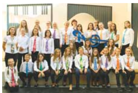
Uherskohradištský dětský sbor.

Uherskohradištský dětský sbor, který se chlubí čtyřicetiletou tradicí, hledá zpěvačky a zpěváky od 6 let do přípravného sboru a od 10 let do staršího sboru.