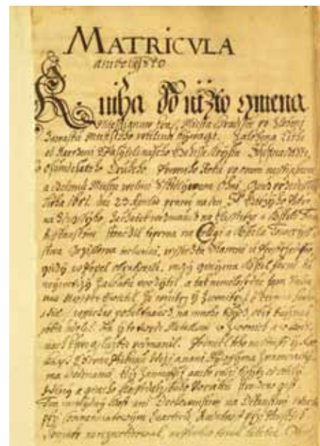
Titulní stránka z knihy přijatých měšťanů z roku 1682.