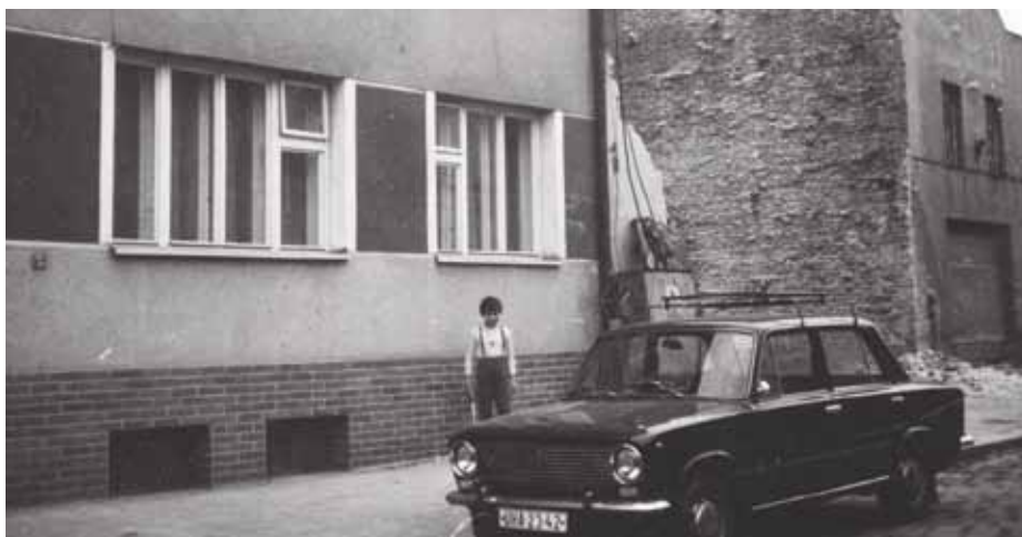
Hradební ulice asi v roce 1981, vlevo dům č. p. 209.