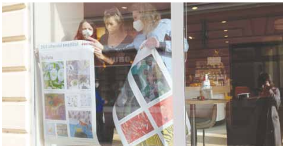
Instalace výstavy ve výloze pekařství.