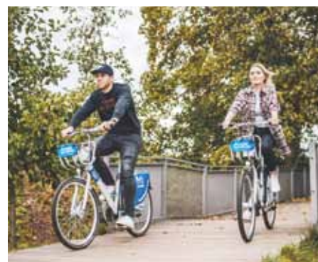
Modrá kola v akci.

Sdílení jízdních kol město zavádí jako podporu udržitelné mobility.