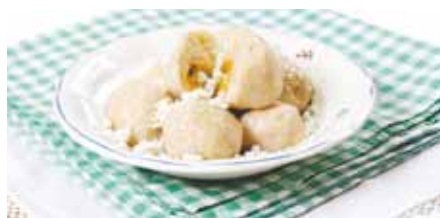
Slovácké domácnosti mohou ukrývat gastronomické poklady.

Denně doma vaříte? Uklízíte ve volných chvílích šuplíky, na které nikdy nezbyl čas a objevujete dávno zapomenuté poklady? A co třeba poklady v podobě starých receptů? Zavzpomínejte na dětství, na mamčinu, babiččinu kuchyni... Vonělo to tam po patentech, milostech, trnkové máčce? Nebo je váš oblíbený rodinný recept úplně jiný? Pokud máte recept, který se dědí u vás v rodině z generace na generaci, a nechcete, aby zůstal pouze v šuplíku, podělte se o něj! Před lety vydal Region Slovácko dva díly Kuchařky tradičních pokrmů na Slovácku s téměř 300 recepty. Jsme si však jisti, že je jich ještě další spousta ukryta. Pokud takový recept máte, nebo třeba i celou sbírku, ozvěte se