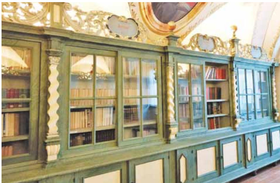
Unikátní barokní skříně (nahore) a lunetová výzdoba sálu (dole).