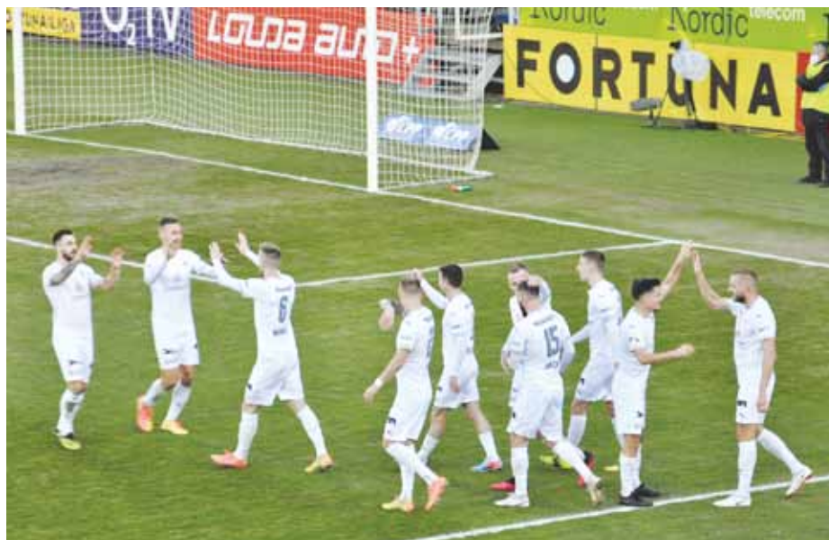
Radost hráčů po gólu do sítě Slaviie (nahore) a souboj před brankou Baníku (dole).

Devět únorových bodů za tři vítězství. S Teplicemi 2:0 (branky Kalabiška a Juroška), v Příbrami 4:1 (Hofmann, Kliment, Petržela, Juroška) a hlavně se soupeřem na špici tabulky v Jablonci 3:0 (Petržela, Kliment, Ciciliu). 1. FC Slovácko se po jedenadvacátém kole usadilo na třetím místě tabulky se 40 body a skórem 41:21, hned za proslulými pražskými „S“.