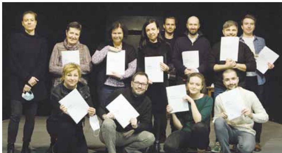
Inscenační tým komedie Perfect Days.