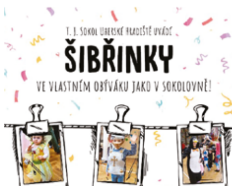
Pozvánka na on-line Šibřinky.

Letos je vše jinak. I sokolové žijí on-line, cvičí a setkávají se na internetu