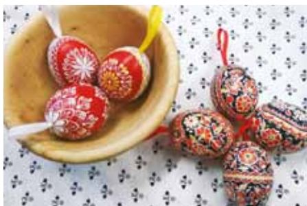
Velikonočních jarmarků jsme se ani letos nedočkali. Tradiční slovácké kraslice i další výrobky ale můžete nakoupit přes e-shop.

Tradičním řemeslníkům i farmářům se nabízí větší možnosti propagace, pomůže jim také e-shop