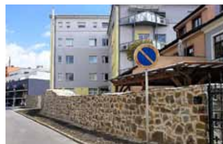
Opravené hradby v Dlouhé ulici.

V průběhu prací bude částečně omezen i silniční provoz na ulici Dlouhá, proto žádáme řidiče o zvýšenou opatrnost.