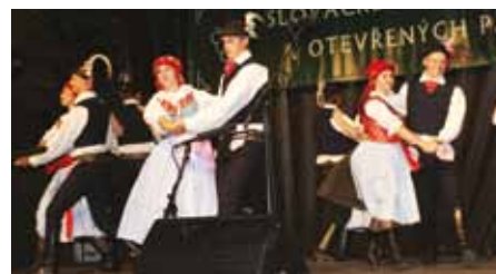
S KKUH online se přenesete i na zahájení Slováckých slavností vína vybraných ročníků.