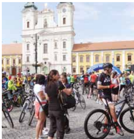
Start na Masarykově náměstí.

Jarní otevření cyklostezek je naplánováno na sobotu 24. dubna, s tímto termínem organizátoři stále počítají a současně se připravují na více možných variant. A to