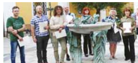
Vítězové 42. ročníku fotografické soutěže na nádvoří Reduty.

o velmi zajímavé finanční ocenění. Podrobnosti, aktuality a soutěžní podmínky naleznete na www.tsttt.cz . -PB-