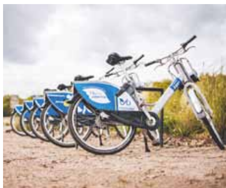
Stanoviště sdílených kol.

K operativnímu využití sdílených kol je určena aplikace pro mobilní zařízení, která je k dispozici na stránkách společnosti Nextbike ( www.nextbikeczech.com ). Registrovanému uživateli (s ověřenou platební metodou / s aktivním účtem) už jen postačí načíst QR kód na sdíleném jízdním kole a může vyrazit. Pro zájemce, kteří nebudou mít k dispozici chytrý telefon, bude možné zapůjčení kola přes