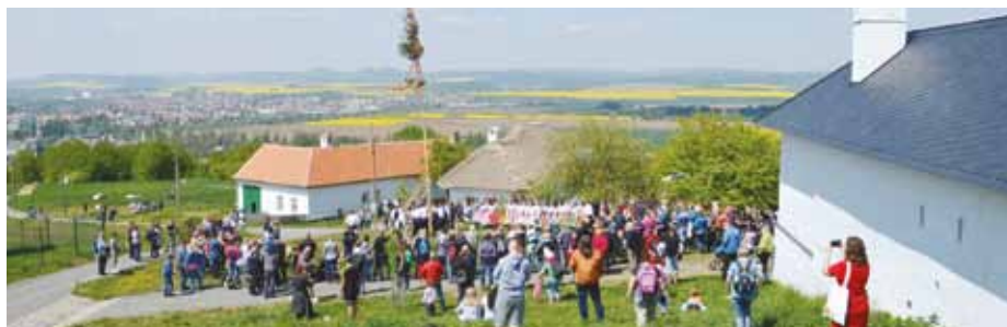
Otevírání pastvin a stavění máje, oblíbená jarní akce.