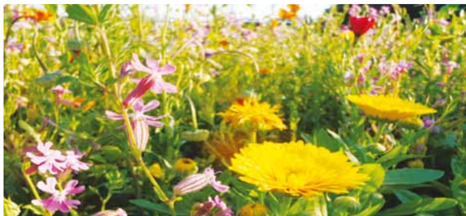
Kvetoucí záhony jsou ozdobou města.