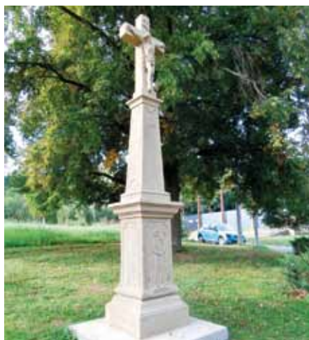
Míkovický pozdně barokní kříž.

„Kříž, ač není dosud zapsán v Ústředním seznamu památek, je cenným dokladem pozdně barokního umění, jakož i úrovně zdejší řemeslné práce druhé poloviny 18. století. Například sokl s podstavcem zdobí reliéf Panny Marie Bolestné, jejíž hrud' je