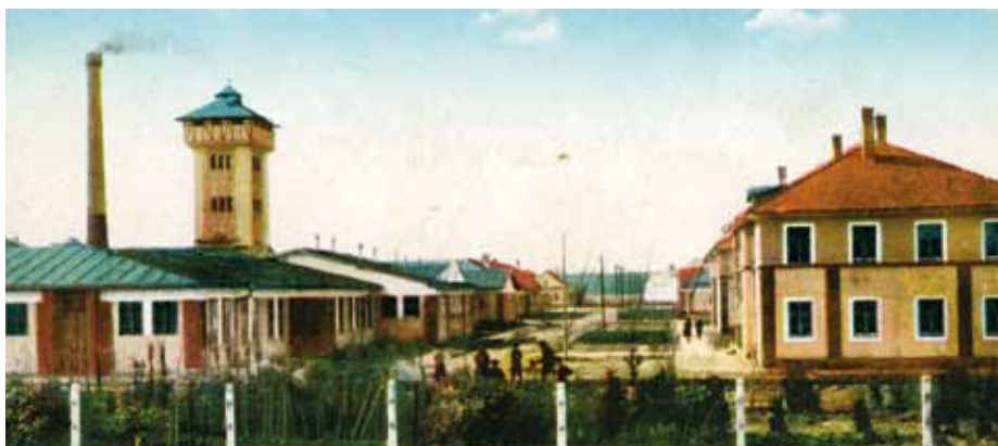
Areál zemské vychovatelny a nemocnice na dobové pohlednici.

Z někdejšího vojenského sanitního tábora se vyvinul moderní nemocniční komplex