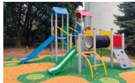
Sídlíště Stará Tenice.

školy a Místní komise Rybárny by se měla finančně podílet na revitalizaci sportovního plácku v Rybárnách. - JP -