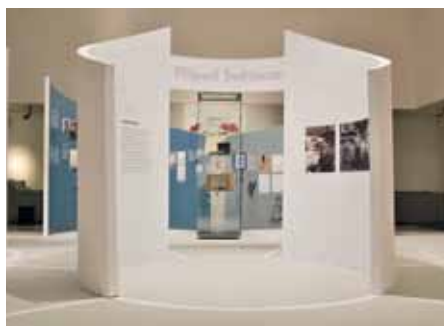
Nápaditě řešená výstava věnovaná organizaci Světlana.