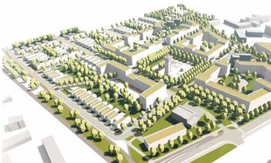
Bytové a rodinné domy, obchody a služby. To vše by mělo vzniknout místo vysloužilých budov nemocnice. Vizualizace: P. P. Architects

Nevyužívané budovy starého nemocničního areálu má nahradit nová městská čtvrť