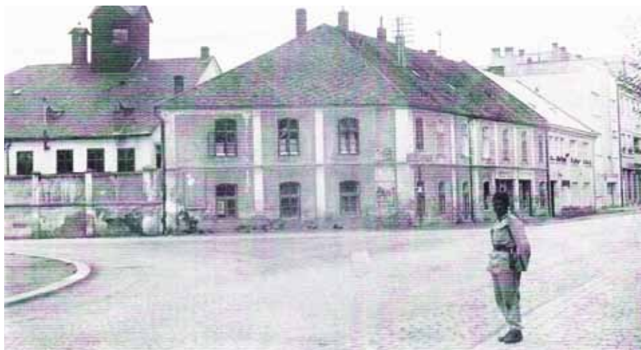
Dům č. p. 176 před přestavbou nárožní části.