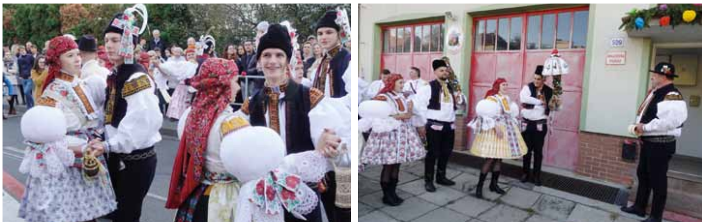
Pestré kroje, tanec a obchůzky ulicemi. V sobotu 16. a neděli 17. října ožily tradičními hody místní části Jarošov (vpravo) a Mařatice (vlevo). Hodové období na území Uherského Hradiště je za námi. Už v září se uskutečnily slovácké hody s právem v Míkovicích a Sadech, na konci srpna ve Věskách. - PS -