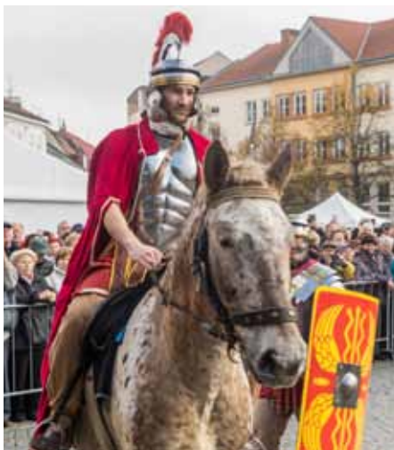
Příjezd svatého Martina na Masarykovo náměstí.

Ať už se jedná o pondělí nebo neděli, v Uherském Hradišti slavíme svatého Martina vždy přesně jedenáctého. Letos k nám zavítá svatý Martin na svém bílém koni ve čtvrtek a předá víno knězi k symbolickému požehnání nové úrody. Vloni, v době „covidové“, jsme byli nuceni šňůru tradičního žehnání pomyslně přehnout. O to více se jistě všichni těší na ochutnávku letošní úrody.