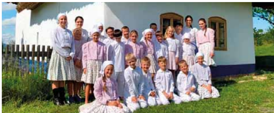
Příměstské tábory Moje Slovácko aneb U tetičky na dědině jsou velmi oblíbené.