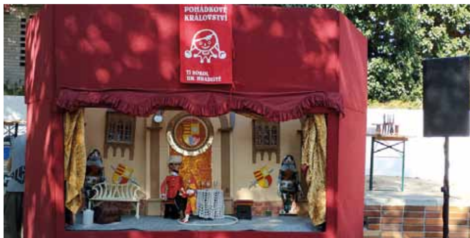
Mobilní loutková scéna v akci.

V neděli se hraje pro veřejnost, ve čtvrtek dopoledne pro děti z mateřských školek