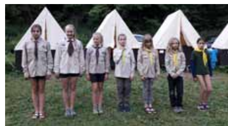
Laňky na táboře, Zdounky-Divoky.

tolerantního partnera. Pak stačí začít skautský slib a chuť pracovat s dětmi a následně složit čekatelskou a nakonec vůdcovskou zkoušku.