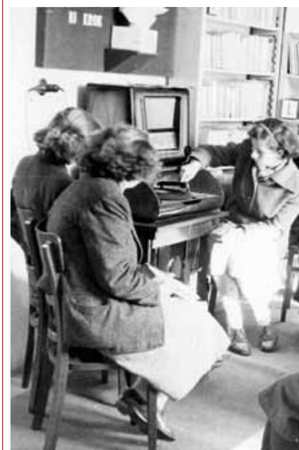
Beseda se čtenáři v roce 1952.