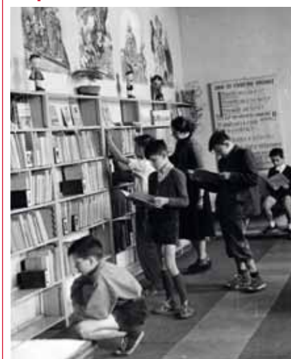
Oddělení pro děti v roce 1951, kdy se knihovna přestěhovala do bývalé židovské synagogy.