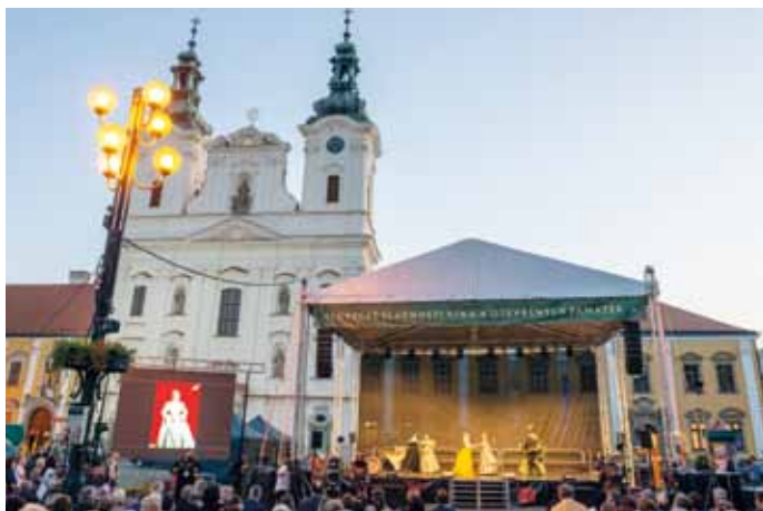
Pátek: Národní zahájení Dnů evropského dědictví.