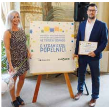
Předávání cen v krajské soutěži O keramickou popelnici v Bystřici pod Hostýnem.

Také celostátní vítěze ocenili zástupci Autorizované obalové společnosti EKO-KOM, která je vyhlásovatelkou soutěže O křišťálovou popelnici. O těch nejlepších rozhodovala celá řada kritérií a přihlíželo se také na celkové podmínky pro nakládání s odpady v obci. Hodnotilo se množství