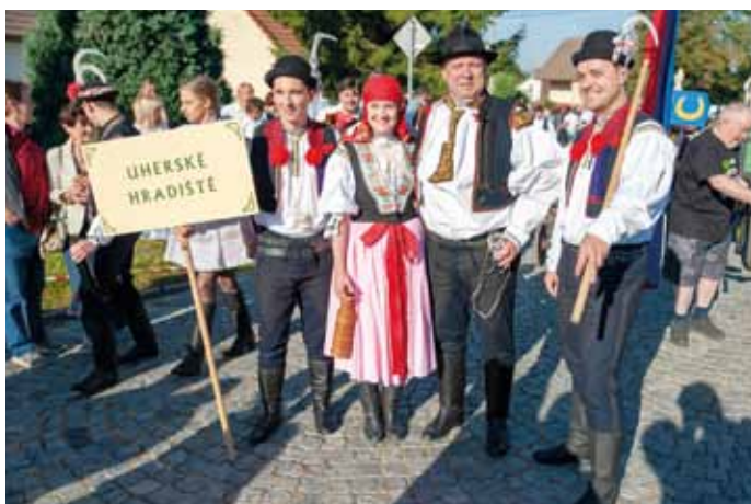
Sobota: Krojový průvod se starostou v čele.