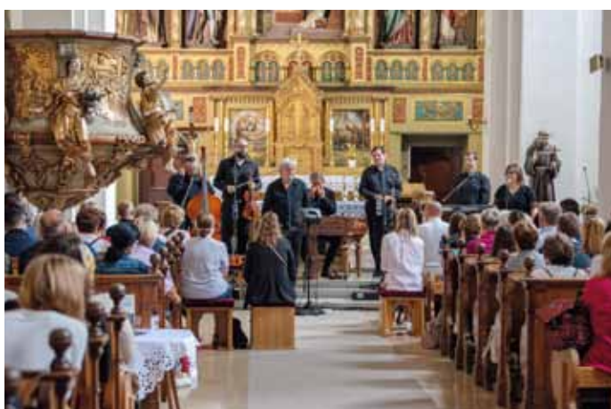
Neděle: Tradiční koncert Hradištanu v kostele.