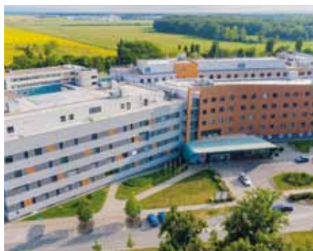
Nová hlavní budova.