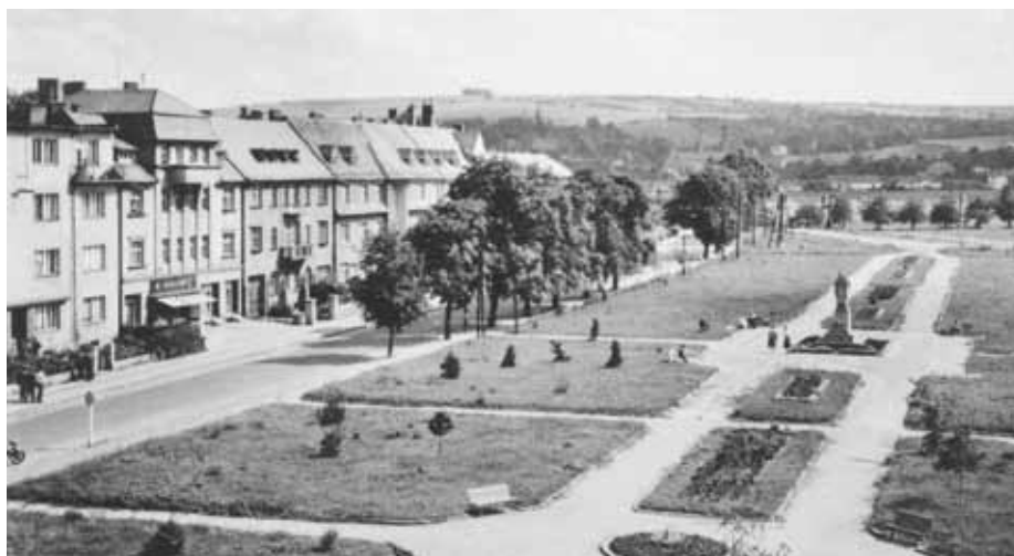
Náměstí Míru kolem roku 1960. Zleva domy č. p. 590, 462 a 464.