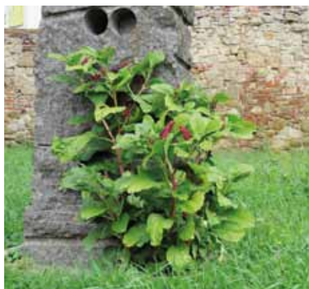
Lícidlo jedlé u Galerie Slovákého muzea.

Doba kvetení u nás nastává především v červenci, někdy pokračuje i v srpnu. Okvětí jednotlivých květů má čistě bílou barvu, bělavé jsou i pestíky. U tyčinek můžeme pozorovat bílou nitku a světle narůžovělé prašníky. Průměr květů se pohybuje od 5 do 10 mm. Jsou seskupeny do květenství jménem hrozen, které zahrnuje několik desítek (30 až 90) květů a měří od 10 do 30 cm. Po opylení hmyzem se vyvíjí zajímavý plod – souplodí osmi černých lesklých peckovic, které je