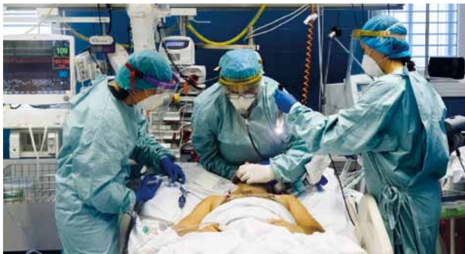
Loni na jaře a na podzim zažívali v nemocnici kvůli náporu pacientů s covidem kritické týdny.

Nemocnice se nepotýkala jen s velkým nárůstem těchto pacientů, ale také s tím, že chyběli zdravotníci. Musela tak poskládat nezbytné zdravotní týmy z ostatních oddělení. Opětovně bylo