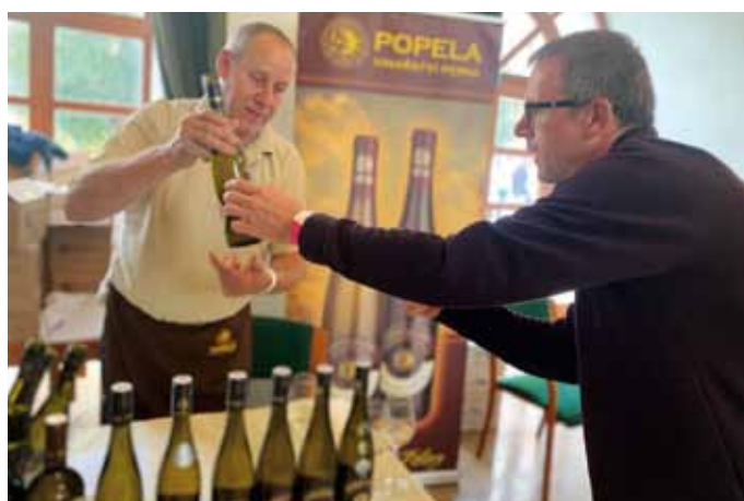
Dobré víno nemohlo chybět.