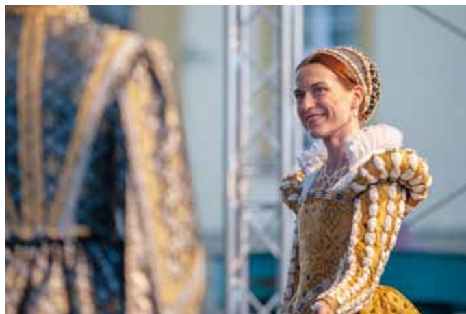
Výpravná historická podívaná.