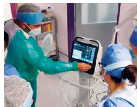
Moderní vybavení je jedním ze základů úspěchu. Nejdůležitější jsou ale lidé.