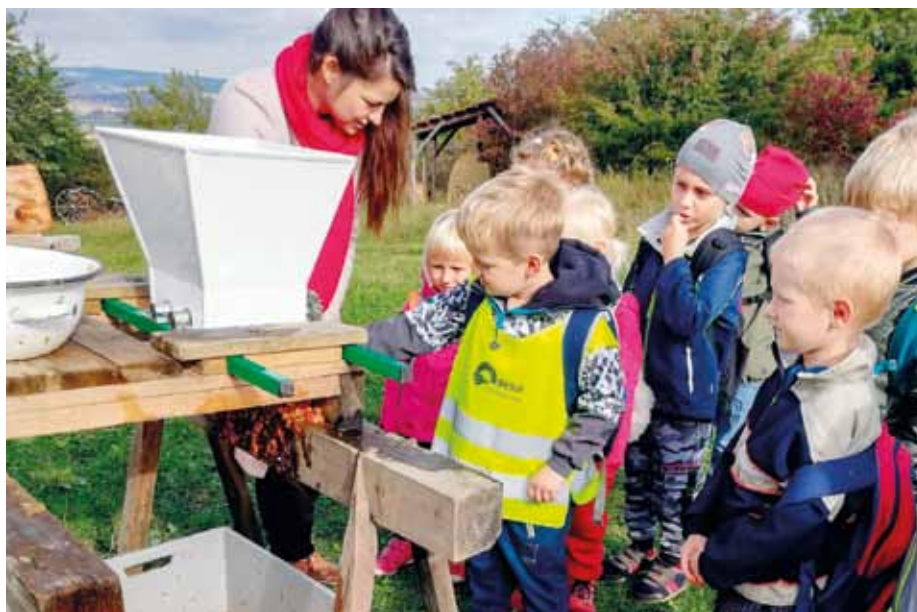
Děti si mohou ve skanzenu vyzkoušet třeba to, jak se vyrábí šťáva z jablek.

Návštěvníky také srdečně zveme na výstavu Ovocní velikáni, která představí památné ovocné stromy na území Uherskohradištska. Výstava bude