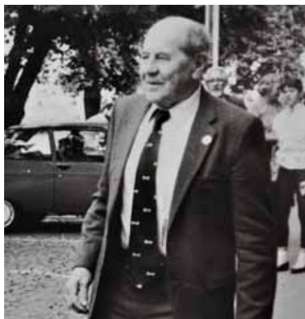
Emil Zátopek v Hradišti.

Dana a Emil Zátopkovi byli pravděpodobně nejslavnějším manželským párem v historii českého sportu. K Uherskému Hradišti měli velice blízký vztah. Vždyť Dana Zátopková, rozená Ingrová, zde prožila mládí a slavila první sportovní úspěchy. A právě v našem městě se konala 24.