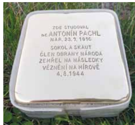
Kámen zmizelých je připravený k zasazení do dlažby.