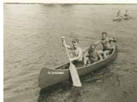
Všestranný sportovec na kurzu plavání v Nymburku.