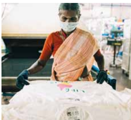
Cílem výstavy je ukázat skutečnou cenu práce.

Výstava na stromech se koná v desítkách parků po celém Česku