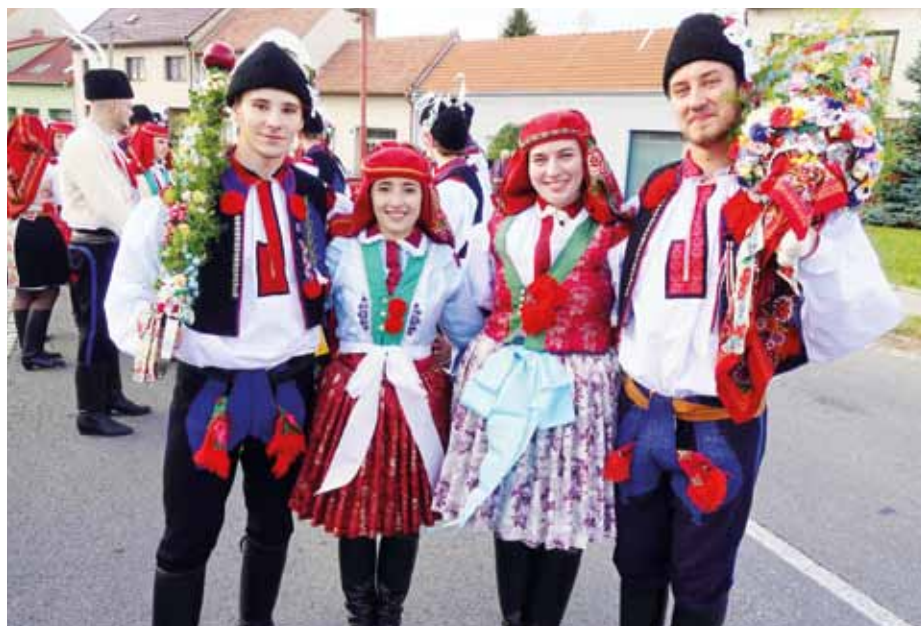
Stárci na míkovičských hodech.

Hody patří na Slovácku mezi nejvýznamnější slavnosti a tato tradice se dodržuje také v městských částech Uherského Hradiště. Účast na hodech je vždy velkou událostí. Hlavně pro rodiny, jejichž členové jsou během hodů stárci. Stárek a stárka jsou ústředními postavami celých hodů. Nechybí slavnostní krojovaný průvod, povolení hodů starostou, obchůzka po obci, hodová zábava při dechové nebo cimbálové muzice a také hodová mše.