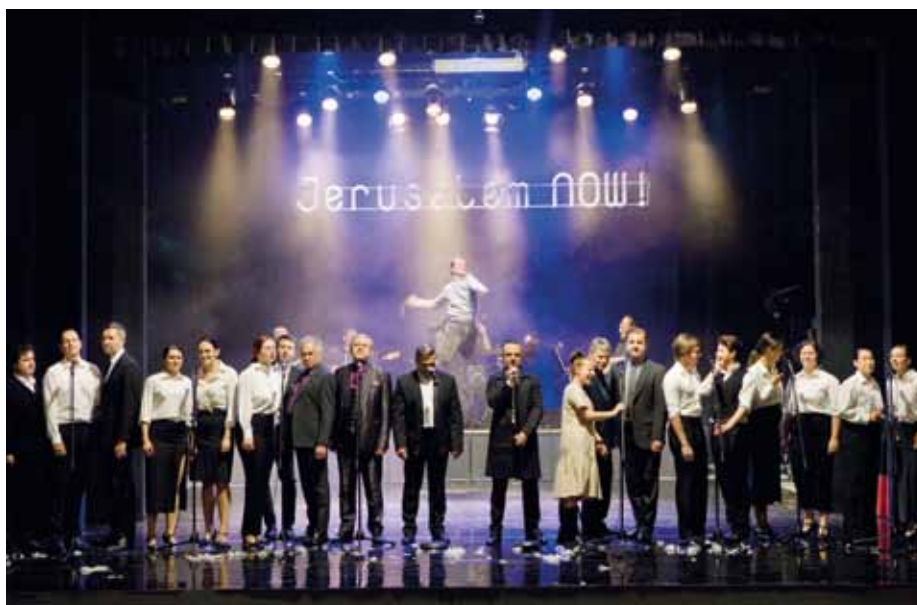
Muzikál Jesus Christ Superstar ve Slováckém divadle.