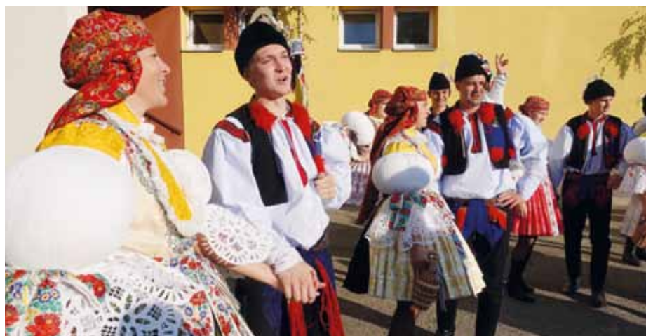
Hodová chasa tančí před kulturním domem v Sadech.