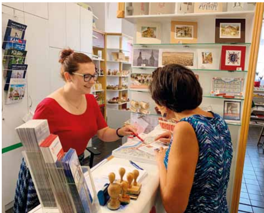
V prostorách hradištského infocentra vám poradí, dostanete tipy na zajímavé akce, můžete si odnést užitečné informační materiály a nebo si v obchůdku nakoupit produkty zdejších výrobců, které poslouží třeba jako skvělý dárek blízkým.