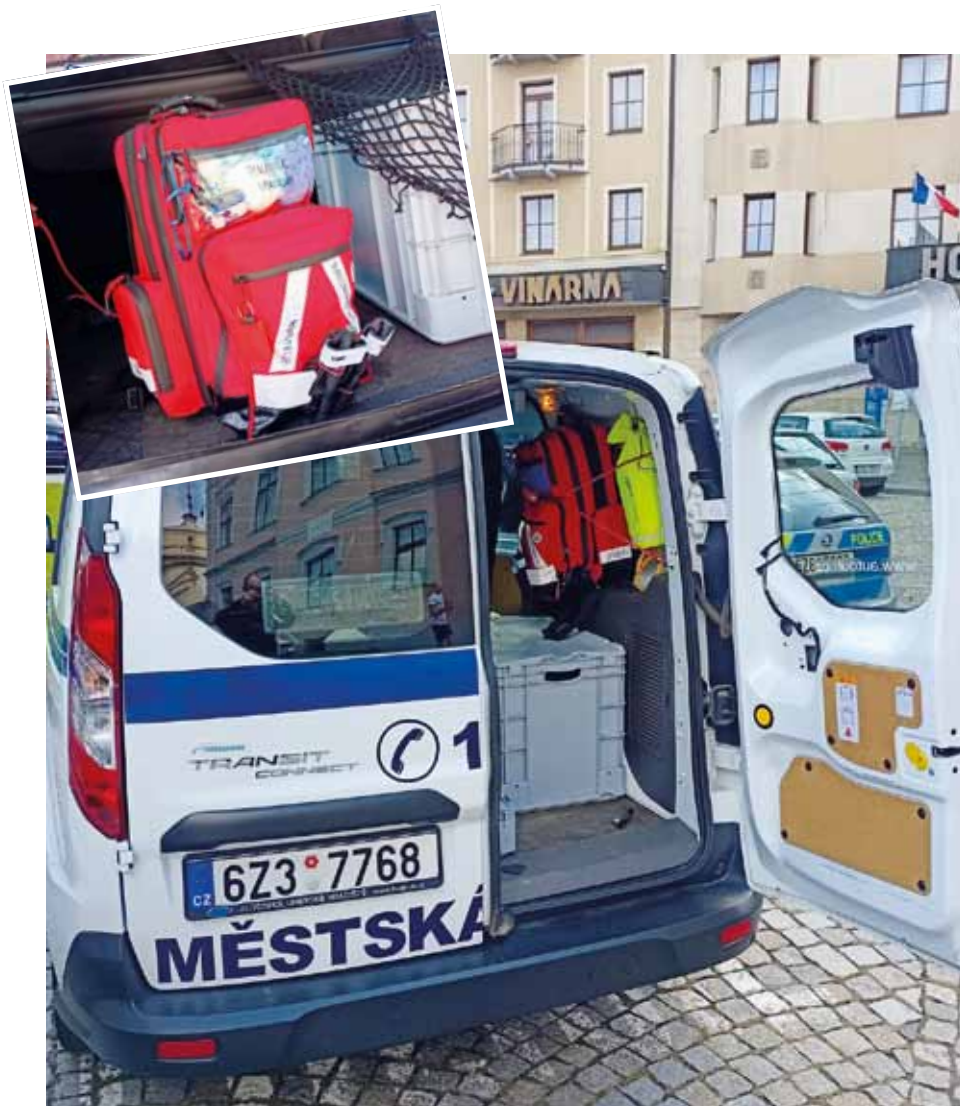
Záchranné batohy, které jsou umístěné ve vozidlech městské policie.