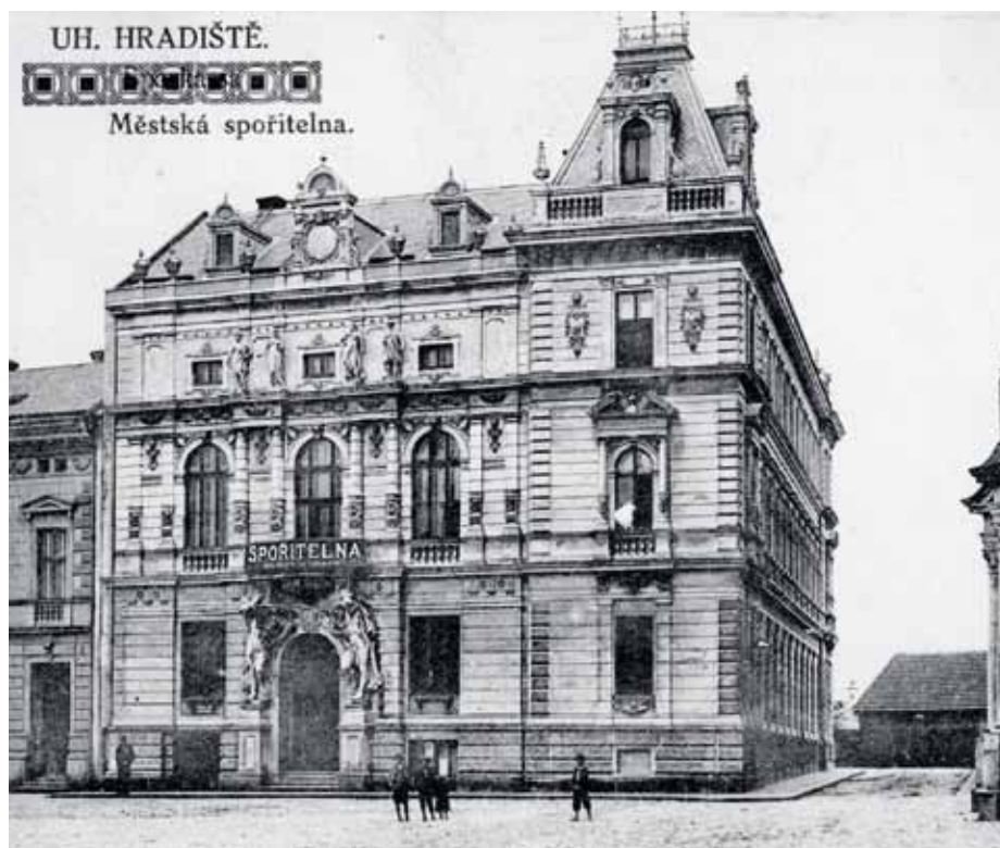
Novorenesanční budova spořitelny a městského úřadu.