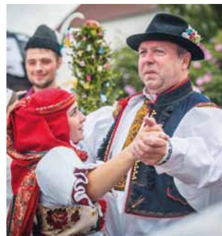
Tanec se starostou na hodech ve Věskách.