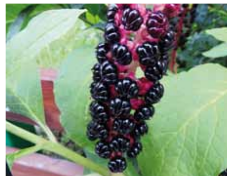
Lícidlo jedlé, plod.