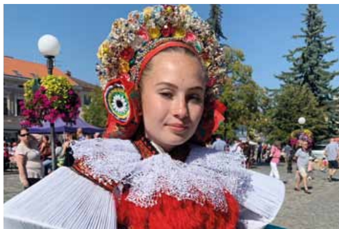
Krása pestrých slováckých krojů.