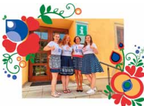
Tým pracovníků Městského informačního centra.