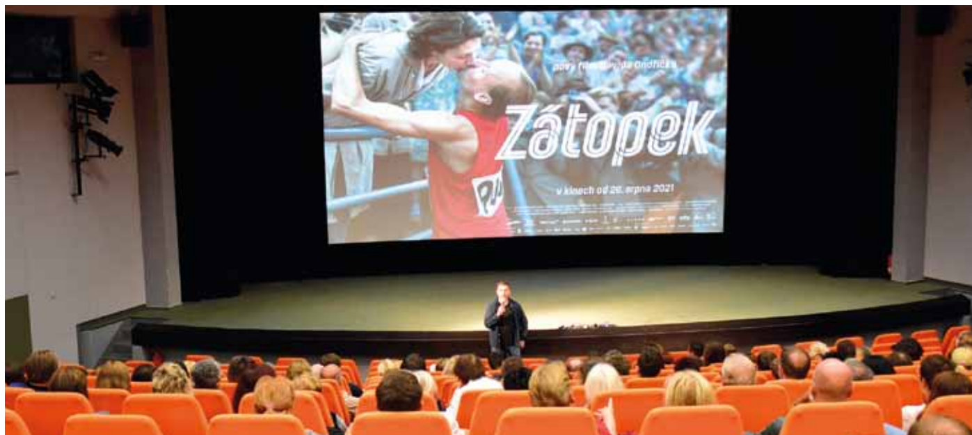
Slavnostní uvedení filmu Zátopek v kině Hvězda.