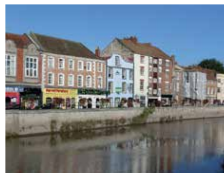
Nábřeží řeky Parrett v centru Bridgwateru.