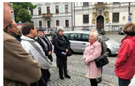
Oblíbené procházky za historií města.

Její odborné práce se dotýkají především oblasti historie, epigrafiky, architektury a památek. Publikovala v řadě monografií obcí a měst, zvláště Uherského Hradiště, Kunovic, Velehradu, Uherského Ostrohu, Hradčovic a v poslední době Podolí, Popovic a Uherského Brodu. Její odborné články