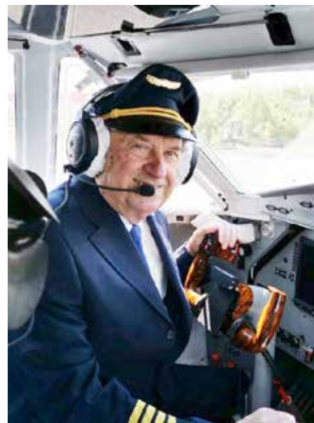
Pilot Stanislav Sklenář.

Stanislav Sklenář byl nejdéle sloužícím profesionálním zkušebním pilotem v republice. Jako zkušební pilot nalétal přes 24 300 letových hodin na motorových strojích a 3000 hodin na kluzácích. Za své zásluhy byl oceněn a v roce 2018 zařazen mezi 100 leteckých osobností století,