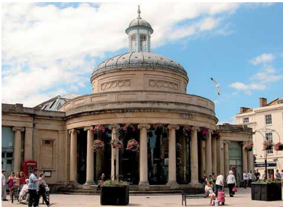
Budova staré plodinové burzy v Bridgwateru.

„Běžná komunikace a vzájemné návštěvy byly už dávno překonány