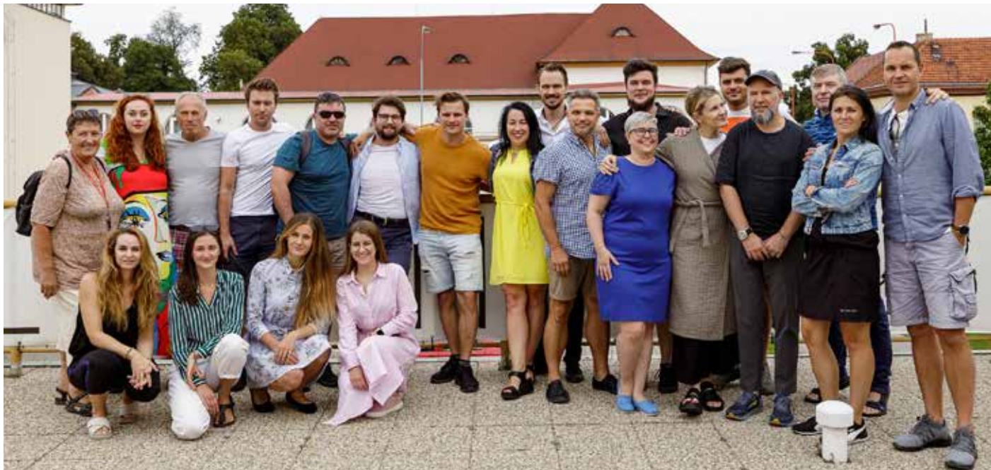
Inscenační tým Cyrana.

Slovácké divadlo chystá netradičního Cyrana. Je bližší dnešnímu člověku