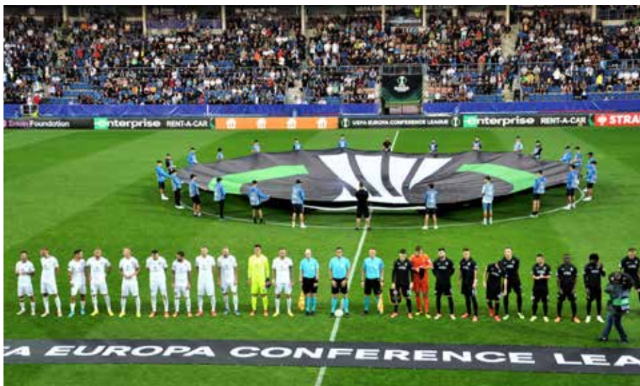
Slavnostní zahájení utkání s Partizanem Bělehrad.