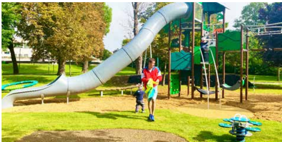
Atraktivní průlezký, skluzavky a houpadla.