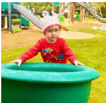
Tohle se točí!

Dětské hřiště je rozděleno do zón pro všechny věkové skupiny dětí. Pro děti do 3 let je zde k využití pískoviště s bagrem, vodopád a stolek pro hru s vodou a pískem, na hřišti je také točidlo pro batolata a houpadla. Pro děti do 6 let je určena dětská věž