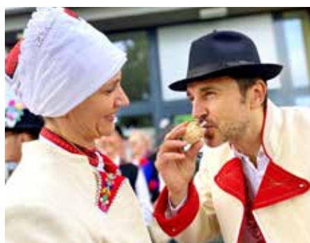
Na zdraví a na slavnosti!