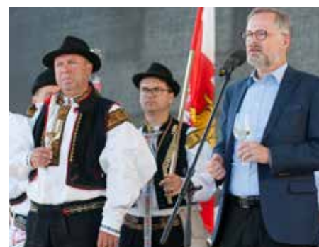
Premiér Petr Fiala a starosta Stanislav Blaha.