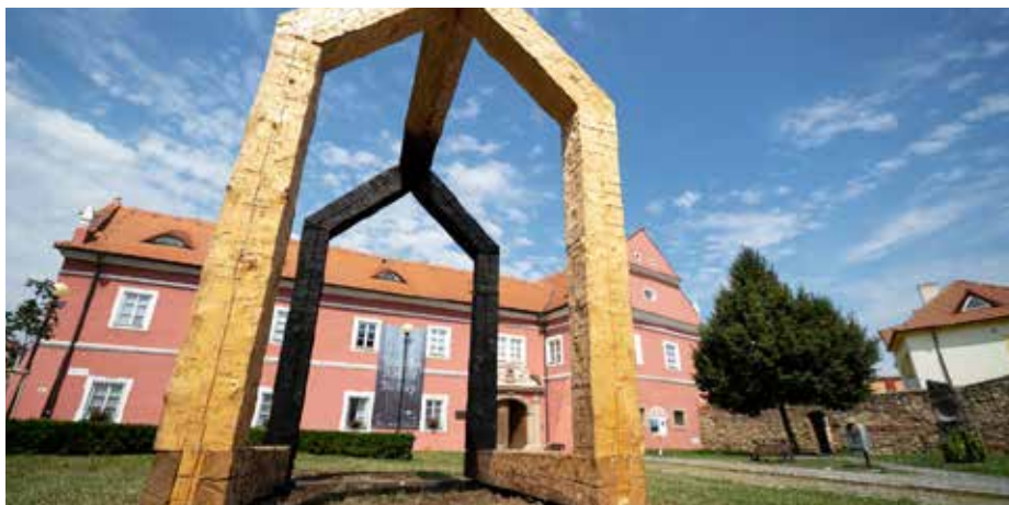
K výročí je připravena komentovaná prohlídka galerie, která se uskuteční 1. prosince.

Šedesátá léta minulého století by se dala charakterizovat jako neobyčejně plodná v celém rozsahu činnosti