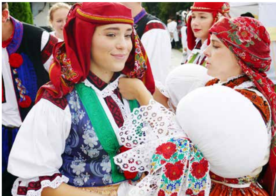
Příprava na průvod.

Slavnostní průvod v krojích, víno od desítek vinařů, vystoupení folklorních souborů a hudebních kapel i jarmark lidových výrobců nabídl 19. ročník Slováckých slavností vína a otevřených památek, který se uskutečnil 10. a 11. září.