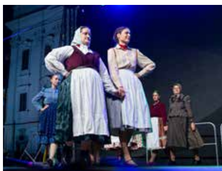
Hosté z partnerského Sárváru.