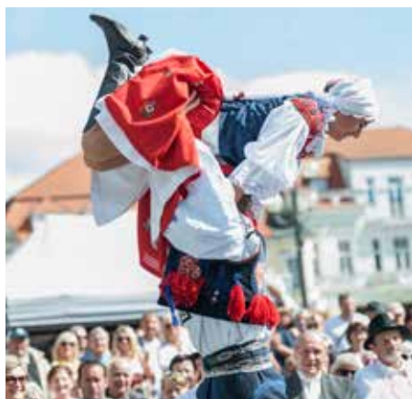
Ve víru tance.