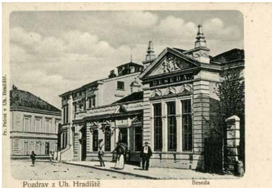
Pohlednice Měšťanské besedy vydaná před rokem 1905.

Spolkové místnosti měl Čtenářský spolek nejprve v hostinci U Zeleného stromu na Mariánském náměstí, později v budově na místě dnešní obchodní akademie. Již v roce 1867 čerstvě ustavená Měšťanská beseda koupila pozemek a postavila na něm snad nejprve dřevěnou, v roce 1871 pak novou zděnou budovu v Hradební ulici. Na její stavbu přispěli mnozí zdejší měšťané, dr. Šrom věnoval 26