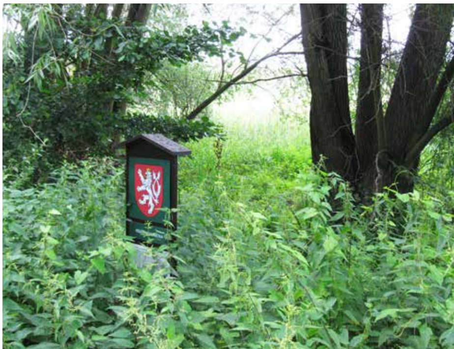
Lázeňský mokřad na jaře.

Z významných rostlinných druhů zde byl zjištěn skřípípec jezerní, kamyšník přímořský, sítina sivá, ostřice srstnatá, kosatec sibiřský a kosatec žlutý, šmel okoličnatý, žlutucha lesklá, ožanka čpavá či česnek hranatý. Směrem k letišti na suchých místech