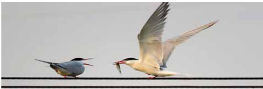
Krmení rybáků jako součást zásunbního letu.

U řeky Moravy v prostoru mezi slepým ramenem Mařacké a železničním mostem můžeme pozorovat řadu ptáků. Zcela běžně uvidíme kachnu divokou, racka chechtavého, lysku černou a v zimě labuť velkou, k vzácným chráněným druhům náleží například ledňáček říční a morčák velký. Zajímavým návštěvníkem, tažným ptákem z čeledi rackovití, je rybák obecný, Sterna hirundo .