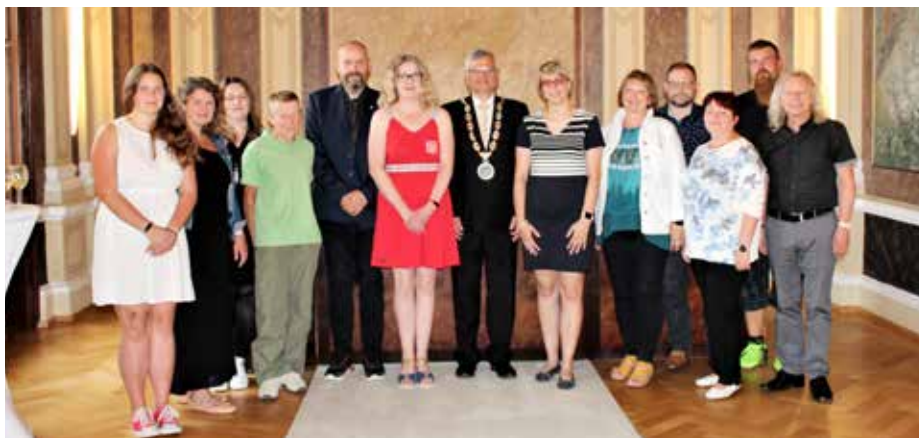
Nejaktivnější chodci byli oceněni na radnici.

Aktivita na podporu přirozeného pohybu opět přitáhla řadu zájemců. Hradiště bylo nejlepší v kraji