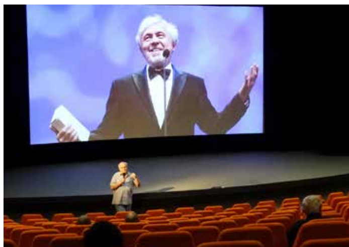
Kino Hvězda se okamžitě po zprávě o úmrtí kunovického rodáka Josefa Abrháma rozhodlo ve čtvrtek 2. června vzpomenout na jeho herecké umění uvedením několika filmů, v nichž účinkoval. Projekce uvedl osobní vzpomínkou dramaturga a pedagog Jan Gogola.