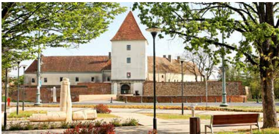
Renesanční hrad Ference Nádasdyho.

Nejmladší partnerské město Uherského Hradiště se na vás těší! Nezbyvá, než se tam zajet podívat. Jsme přesvědčeni, že nebudete litovat. - MS -