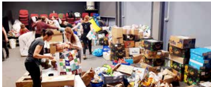
Divadelníci zorganizovali potravinovou sbírku pro Ukrajinu.