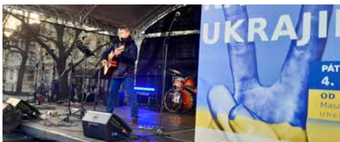
Divadelníci se podíleli i na koncertu pro Ukrajinu na náměstí.