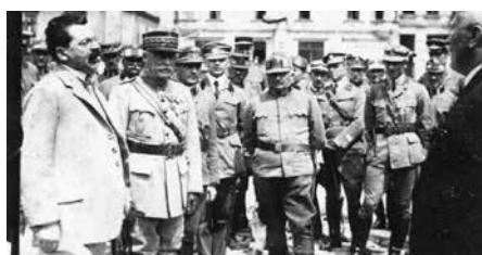
Ministr Václav Klofáč (úplně vlevo) a generál Maurice Pellé (druhý zleva) v Uherském Hradišti.

„Krátke po 12. hod. v sobotu dne 19. července 1919, přijel do Uherského Hradiště ministr národní obrany p. V. Klofáč s franc. generálem Maurice Pellé