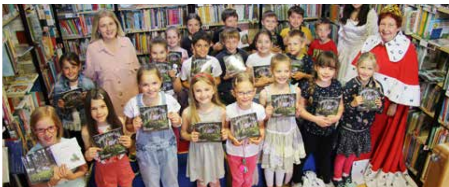
Nově pasovaní čtenáři získali odměnu v podobě knihy Dubánek a tajný vzkaz .