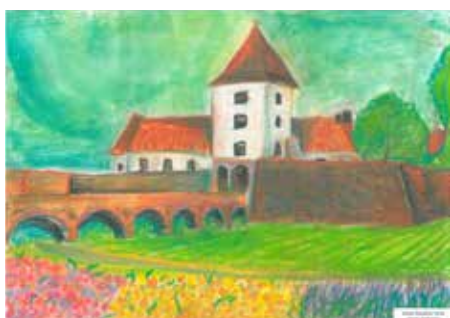
Dorián Rouchon, 13 let, Sárvár