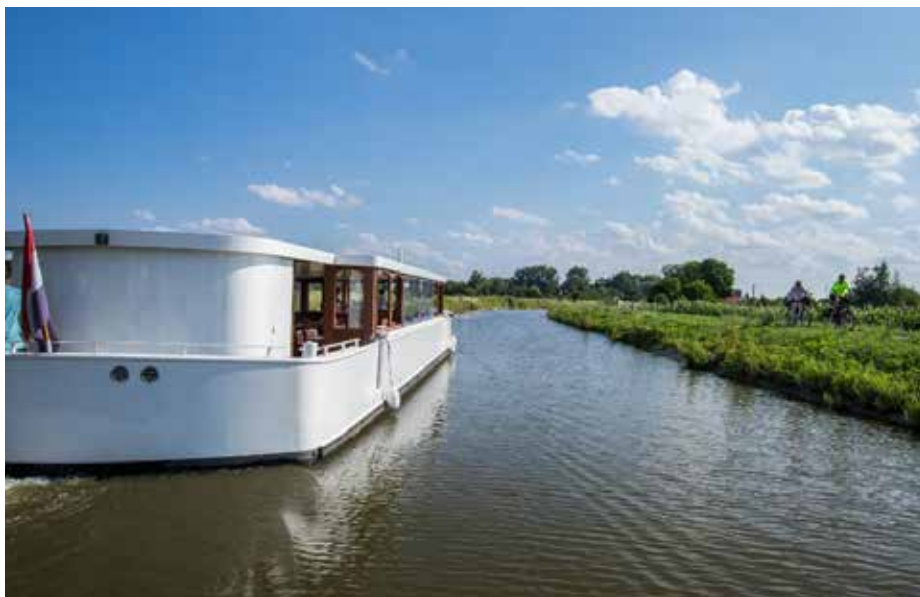
Lod' Hollandia brázdí vody řeky Moravy a Baťova kanálu.

Lod' Hollandia ovšem vyplouvá i na jih, konkrétně přes Kostelany nad Moravou do Uherského Ostrohu. Zde máte na výběr mezi plavbou zpáteční nebo jednosměrnou. Z Uherského Hradiště do Uherského Ostrohu se vyplouvá každou sobotu