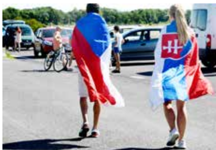
Výstava odkazuje ke 30. výročí rozdělení Československa.

Expozici připravuje ČTK u příležitosti 30. výročí rozdělení Československa. Autoři výstavy Česko/slovenské okamžiky vybrali bezmála 130 snímků, které zachycují důležité i méně známé momenty ze společné historie, dvojího rozpadu československého státu, stejně jako vzájemné vztahy Čechů a Slováků v posledních 30 letech. „Naší ambicí není odvyprávět do detailu dějiny Československa a jeho rozdělení. Chceme prostřednictvím zpravodajských fotografií ukázat, co nás spojovalo, ale