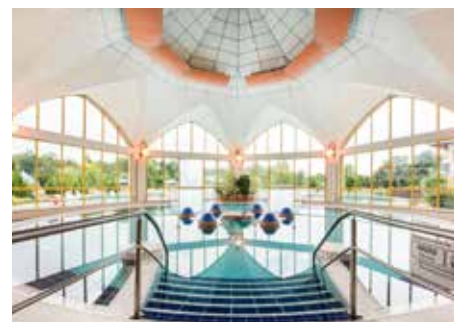
Sárvár je vyhlášený svými lázněmi.