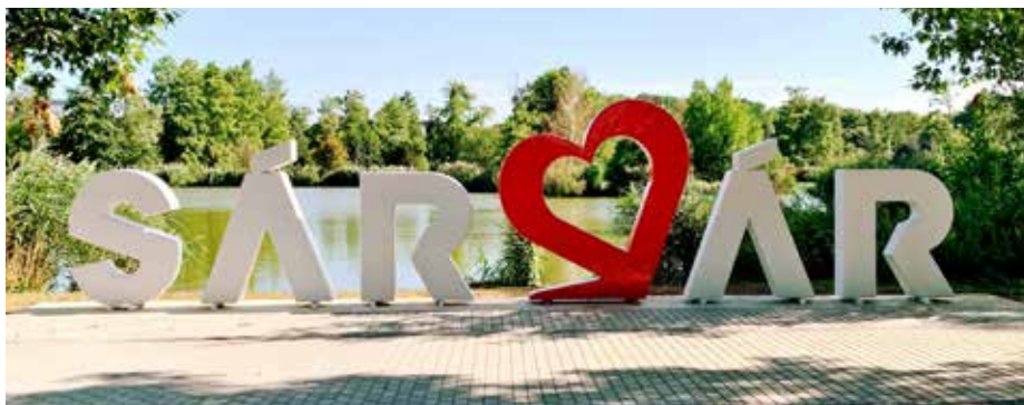
Do partnerského Sárváru dojedete autem za pár hodin.

Partnerské město v Maďarsku láká na místní lázně, ale to zdaleka není všechno