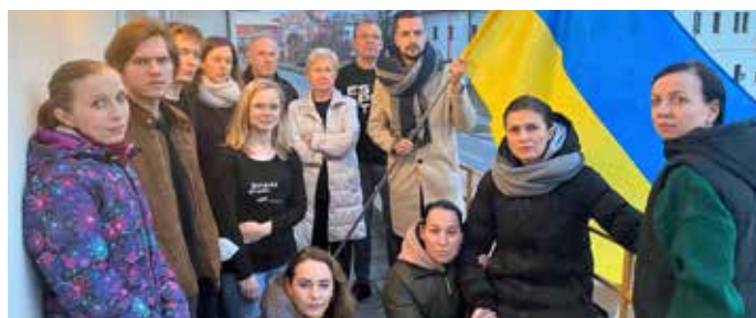
Vyvěšení ukrajinské vlajky na budově divadla.