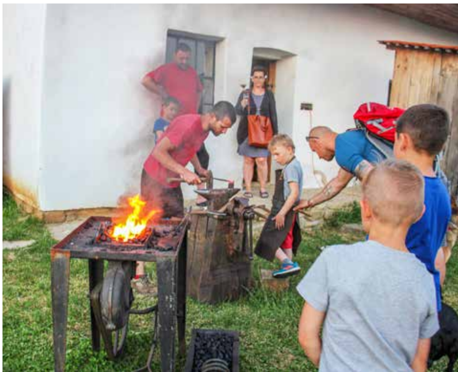
O prázdninových víkendech zavítají do skanzenu řemeslníci, například kovář. Foto: Park a skanzen Rochus

Druhý ročník projektu Řemeslné léto ve skanzenu Rochus odstartujeme už první prázdninovou sobotu a neděli. Během červencových a srpnových víkendů si budeme do usedlostí našeho muzea zvat vybraného řemeslníka nebo rukodělného tvůrce, který návštěvníkům předvede poctivou řemeslnou práci. Těšit se tak můžete na celou škálu témat – od tvorby z kukuřičného šustí