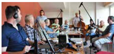
Pondělníci s rozhlasovou technikou.