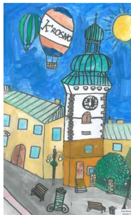
Pola Płatek, 11 let, Krosno