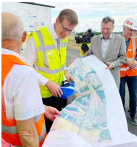
Ministr dopravy Martin Kupka na stavbě dálnice (vlevo) a ministřyně obrany Jana Černochová se starostou před hradištskou radnicí.