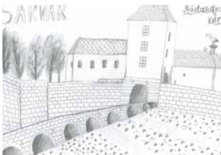
Vica Bozzay, 9 let, Sárvár