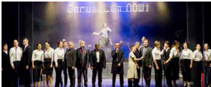
Jesus Christ Superstar uchvátil publikum i herce.

Jaká byla uplynulá sezóna podle divadelníků? Nejsilnější zážitky jim přinesl Jesus