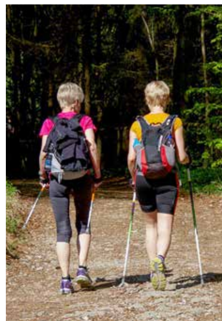
Chůze je přirozený a zdravý pohyb.