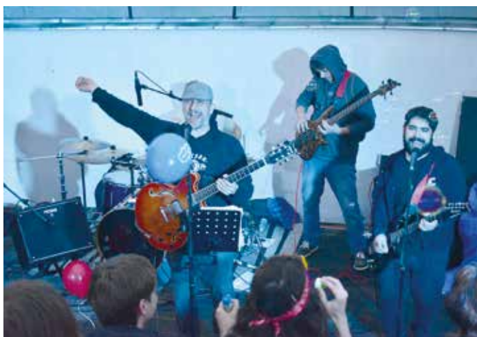
Letní sezónu v atriu kina Hvězda odstartoval 27. května koncert zlínské kapely Reggay a strážnických multižánrových Skamafutra (na snímku). Dešťové přeháňky neodradily hudebníky ani diváky, takže pozitivní vibrace zamračené počasí neodvanulo.

Atrium kina Hvězda, 22. července v 19.30 hodin.