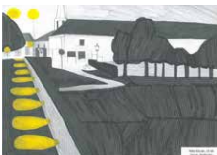
Réka Kóczán, 13 let, Sárvár