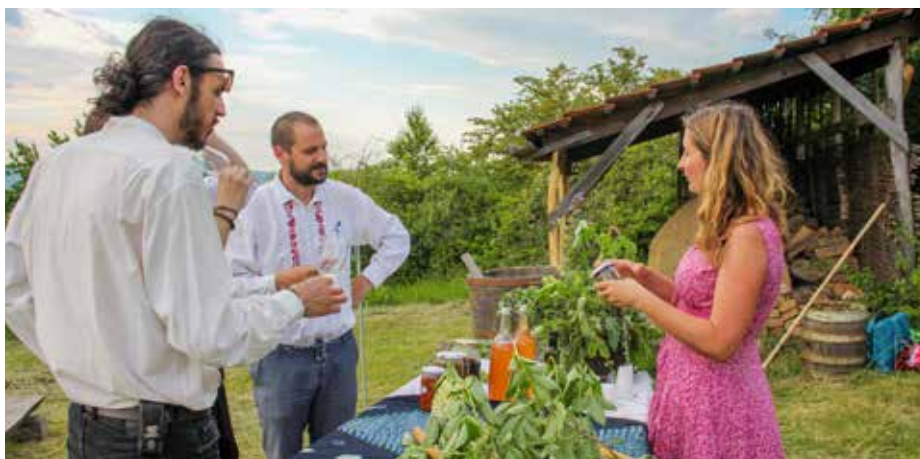
Skanzen provoní čerstvě natrhané byliny.

Po dobu konání muzejní noci bude návštěvníkům zpřístupněna také barokní kaple svatého Rocha. Vstupné na akci Rochus pod hvězdami je dobrovolné. Změna programu vyhrazena. Akce je součástí projektu Louka čaruje, který je spolufinancován Zlínským krajem. - VŽ -