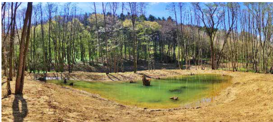
Biocentrum u Míkovického potoka.

Od přehrady se vydáme vpravo po levém břehu proti proudu potoku, po červeně značeném okruhu do lesa Hlubočku, ležícím již na katastrálním území města Hluku. Před ním, v závěru údolí v trati Rúbanice je zahradní chata, na které je pamětní deska, připomínající, že zde 31. ledna 1945 v nerovném boji s německými okupanty zemřelo sedm partyzánů.