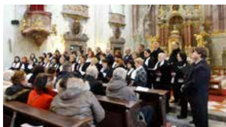
Vystoupení ve farním kostele.

Zkoušíme každý čtvrtek v Redutě od 18.45 do 20.45 hodin. - SS -