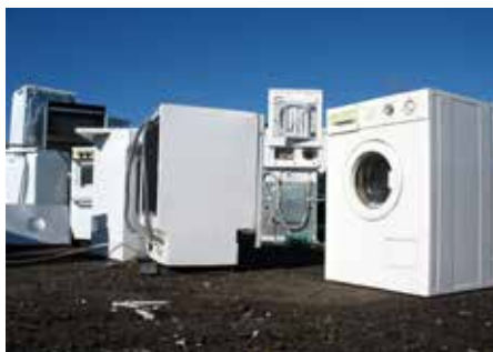
Spotřebiče k recyklaci.