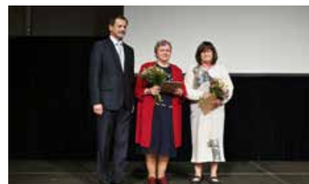
Ocenění za dlouhodobý přínos v pedagogické praxi.