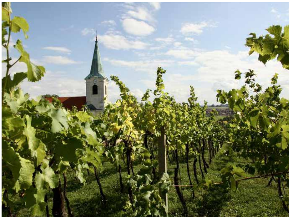
Kostel Narození Panny Marie v Sadech a okolní vinohrady.

Ze situace celkem zřetelně vyplývá, že sídliště s kostelem na pravém břehu Olšavy bylo ve 13. až 15. století vedlejší součástí Kunovic, od kterých se odloučilo nedlouho před uvedeným datem a získalo pojmenování podle německého Dörfel, tedy Vesnička, Víška. V důsledku této změny mimo