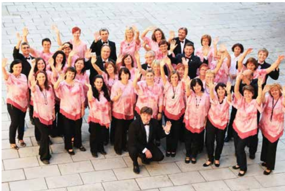
Smíšený pěvecký sbor Svatopluk.

Smíšený pěvecký sbor Svatopluk zve do svých řad