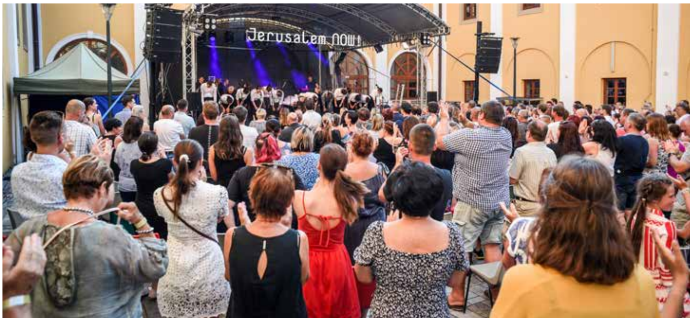
Muzikál Jesus Christ Superstar na Kolejním nádvoří.

Divadelníci se chystají na léto, budou hrát v kulisách města pod otevřeným nebem