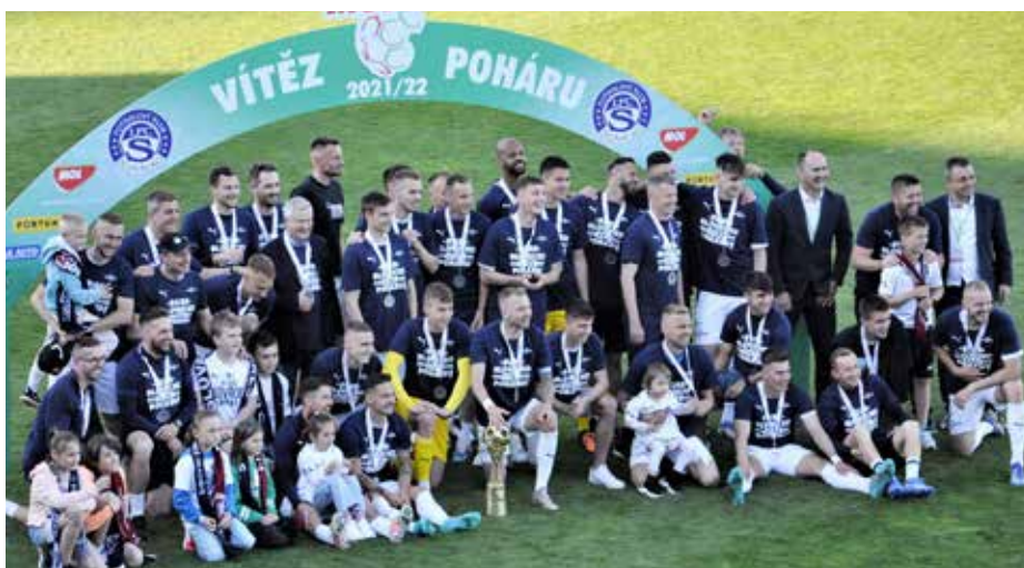
Fotbalisté Slovácka pózuji s vítězným pohárem MOL Cupu.

Ve středu 4. května se mělo hrát v Uherském Hradišti finále MOL Cupu se Spartou Praha, dvouhodinová průtrž mračen to však znemožnila. Zápas byl odložen na 18. května, kdy slovácký tým triumfoval 3:1 a získal pohár. K tomuto