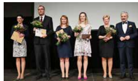
Pedagogičtí pracovníci škol ostatních zřizovatelů.