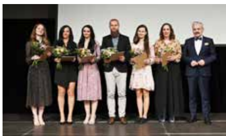
Vynikající začínající pedagogický pracovník.

mateřské školy (na Větrné a v Jarošově) jsou součástí sloučených subjektů základních škol.