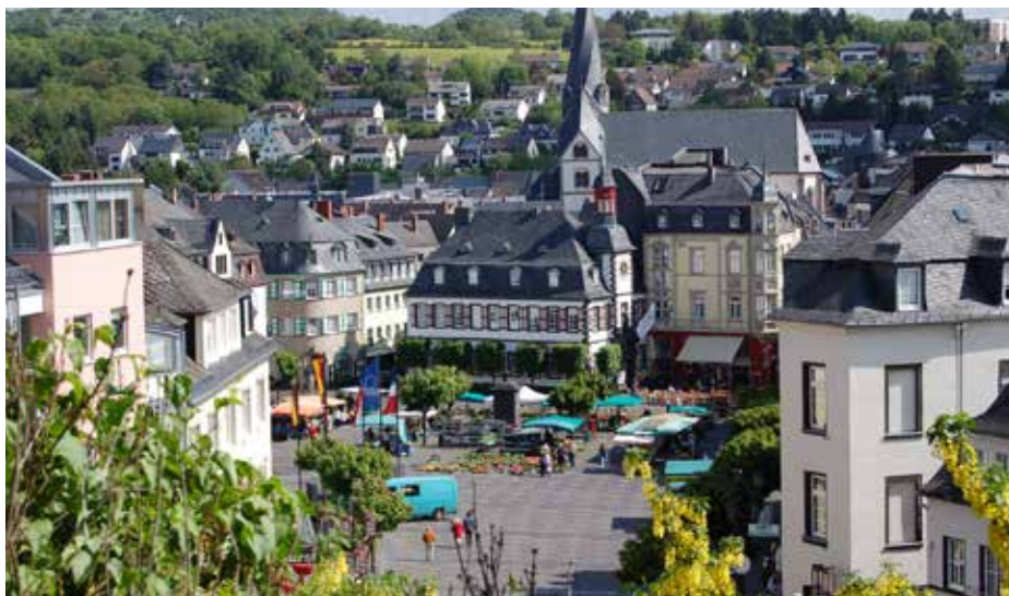
Město Mayen – pohled na náměstí.