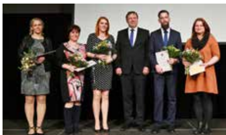
Výrazná pedagogická osobnost.

Město je zřizovatelem šesti základních škol. Z mateřských škol je deset škol sloučeno v jeden právní subjekt s názvem Mateřská škola Uherské Hradiště – Svatováclavská. Další dvě