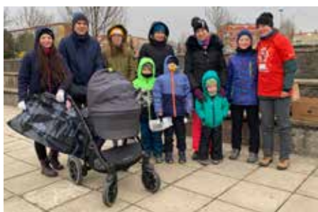
Jeden z týmů, který uklízel na sídlišti Východ.