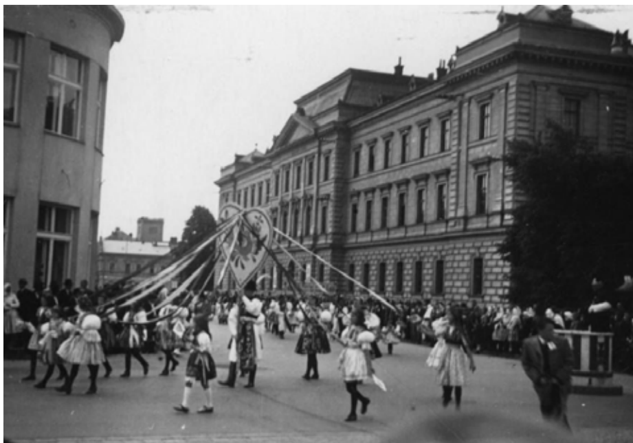
„Mládež ve svátečních krojích Uherskohradištska při slavnosti Dne matek, 18. května 1939.

Květen 1939: Jak se na Slovácku slavil Den matek