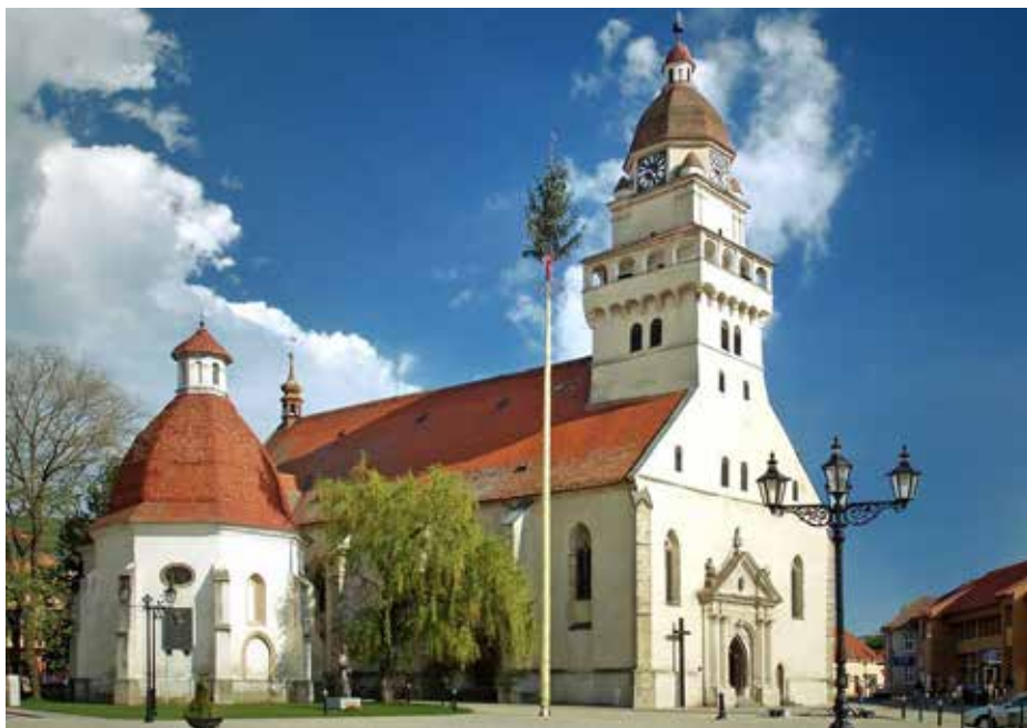
Farský kostol sv. Michala na námestí.