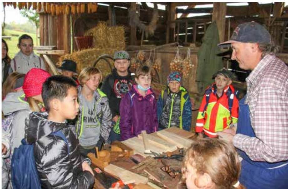
Ukázka tradičních řemesel.

Nejčastějším programem, který si školy z naší nabídky vybírají, jsou „Návraty k tradici“, na kterém se žáci seznámí s životem na slovácké dědině a poznají vybrané prvky tradiční lidové kultury tohoto regionu. Další oblíbeným program „Vše o včelách“ se zaměřuje na život včel. Zjistíme, co všechno pro nás včely dělají a jak jsou užitečné. Ukážeme si, jak to vypadá v úle, co