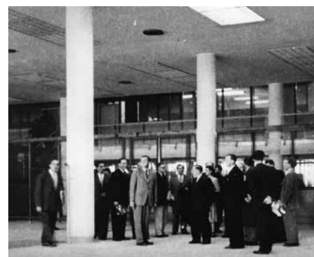
Ze slavnosti otevření 10. května 1952.