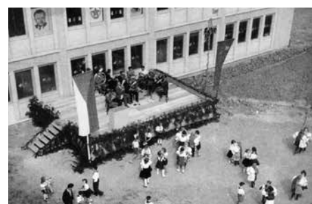
Slavnostní otevření nové budovy 10. května 1952.