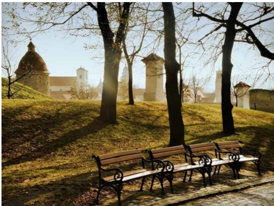
Pohľad na panorámu mesta Skalica z Kalvárie, v pozadí Rotunda sv. Juraja a Jezuitský kostol sv. Františka Xaverského.

Toto malebné mesto sa neustále rozrastá, avšak jeho historické centrum ostáva zachované. Starobylé pamiatky, sprístupnené počas celého roka, sa tešia svojej vysokej návštevnosti. Najstaršou a najznámejšou historickou pamiatkou Skalice je Rotunda sv. Juraja pochádzajúca z 11. storočia. Oblúbenou pamiatkou je zrekonštruovaný Jezuitský kostol sv. Františka Xaverského sprístupnený aj so svojimi podzemnými kryptami. Unikátny výhľad na mesto si možno vychutnať z veže Farského kostola sv. Michala na námestí, neopakovateľné zážitky možno nadobudnúť počas prehliadky technickej pamiatky Mlyna bratov