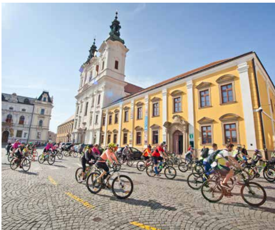
Dokončení revitalizace jezuitské koleje vyneslo před deseti lety Uherskému Hradišti titul Historické město roku.