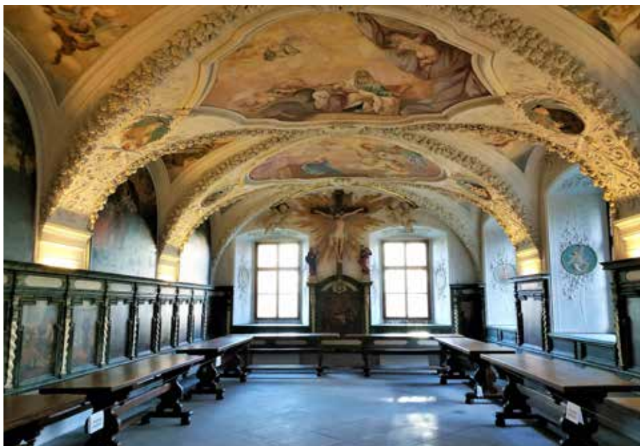
Mezi nejpůsobivější a nejoceňovanější památky ve městě patří refektář někdejšího františkánského kláštera.

Celostátně ne, vyhráli jsme ale opakovaně v krajském kole soutěže, naposledy jsme z prvního místa v kraji postupovali do republikového kola před dvěma lety. Na úrovni kraje město také vyhrálo v soutěži Památka roku Zlínského kraje, nejnověji v roce 2019