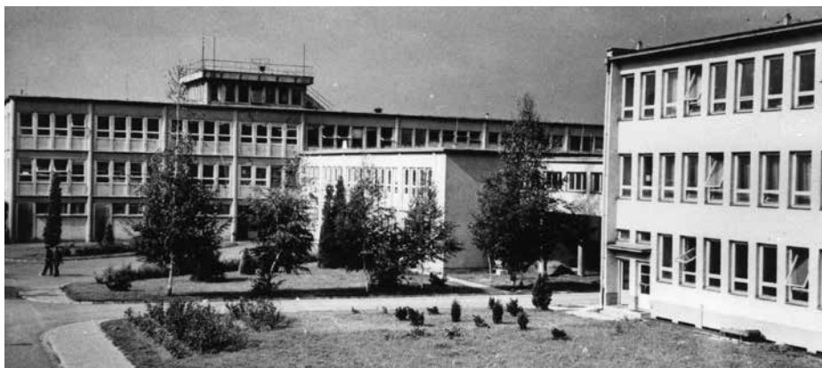
Celkový pohled na areál podniku, nedatováno.