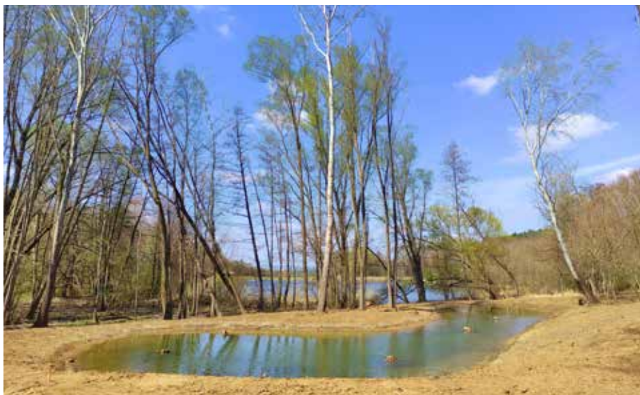
Tůně u míkovické nádrže. Zcela hotovo bude do konce roku.

Po revitalizaci spleného ramene Starka v Míkovících se jedná o další počín spolku v oblasti posilování přirozeného ekosystému krajiny Poolšaví. V budoucnu by chtěli kunovští rybáři