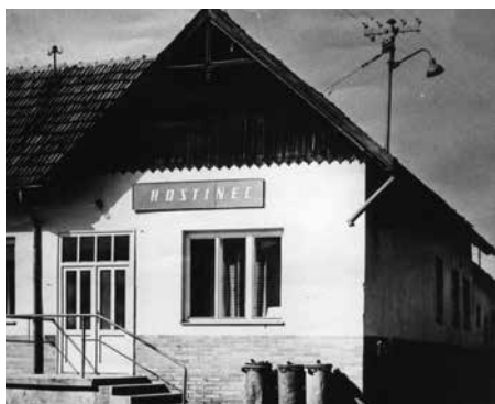
Hostinec U Pučalíků – první sídlo nového podniku.

Souběžně s výstavbou nového závodu byla v roce 1951 zahájena výroba v provizorní mechanické dílně umístěné v mařatickém hostinci U Pučalíků. Obráběcí stroje, získané převážně převodem z podniku v Modřanech, byly instalovány na jevišti, v sále byla zřízena montážní dílna a v přilehlých výčepních místnostech kanceláře. Na sklad materiálu zbyl jen sklep. V dílně byly podle převzaté dokumentace vyráběny motoampérmetry, postupně byly do výroby přejímány všechny druhy leteckých zásuvek a zástrček, s jejichž výrobou bylo počítáno i v nově budovaném závodě.