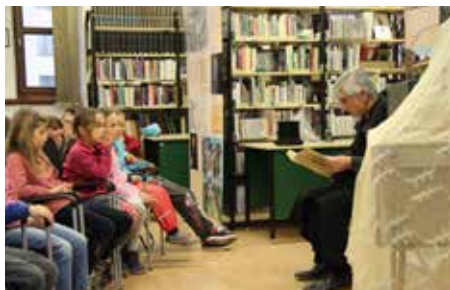
Noc s Andersenem – Hans Christian Andersen.