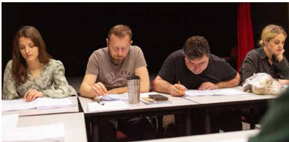
Čtená zkouška textu.

A proč si divadelníci zvolili za své jeviště zrovna soud? Hra Teror totiž řeší napínavý soudní případ pilota, který sestřelil civilní letadlo, a celá se odehrává v soudní síni. Právě do jejich lavic usednou i diváci.