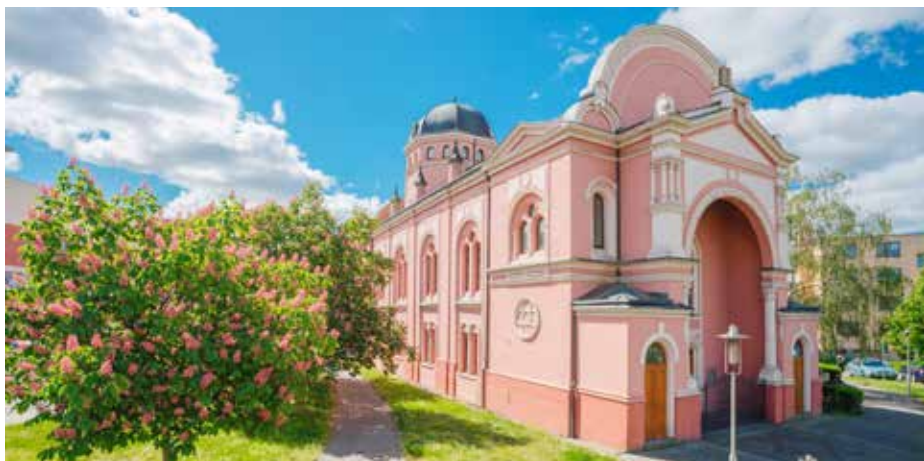
Někdejší synagoga, dnes sídlo uherskohradištské knihovny.

„Každý rok hledáme vhodné objekty, na které jsme schopni čerpat dotace z Programu regenerace městských památkových zón a právě opravu fasády knihovny jsme vloni vybrali jako ideální projekt. Je to dvacet let od poslední