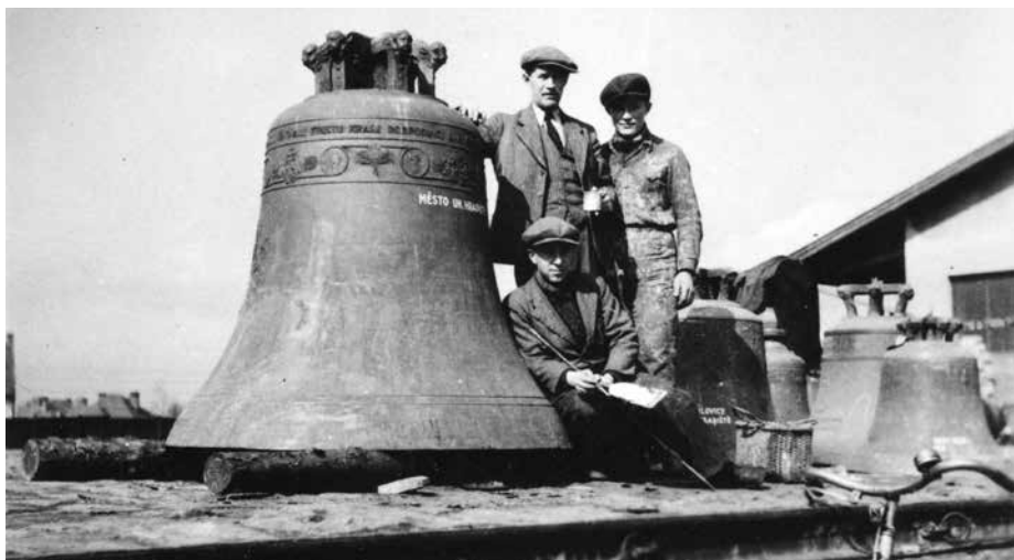
Největší zabavený zvon farního kostela opouští město 18. dubna 1942.