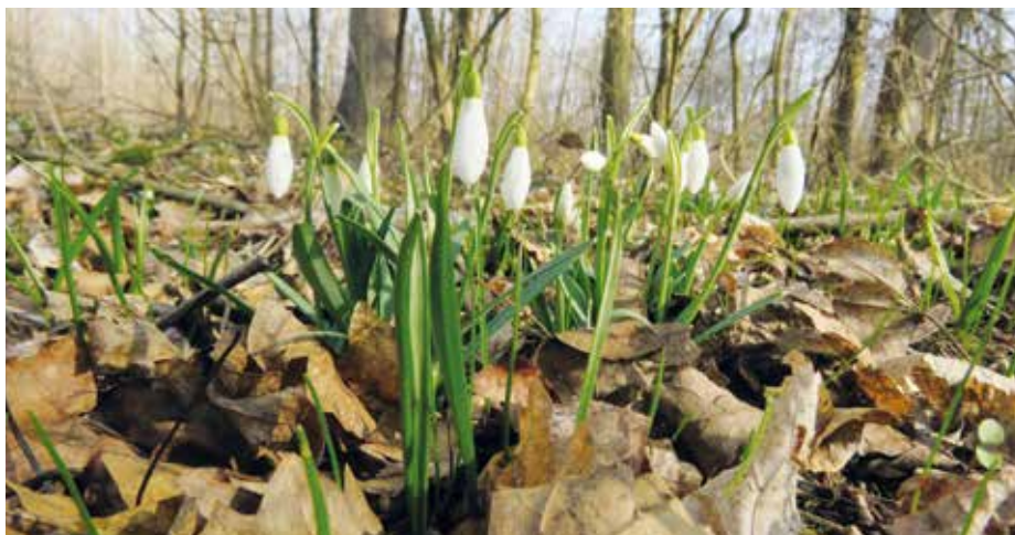
Květuící sněženky v Kněžpolském lese.

Okvěti měří průměrně 2 cm, skládá se ze šesti lístků. Tři vnější jsou delší a většinou čistě bílé, jen vzácně na nich můžeme pozorovat světle zelené proužky. Tři vnitřní okvětní lístky jsou až o polovinu kratší. Základní barvou je opět bílá, na vnějším srdčité vykrojeném okraji je běžné světlezelené či nažloutlé zbarvení. Tyto vnitřní