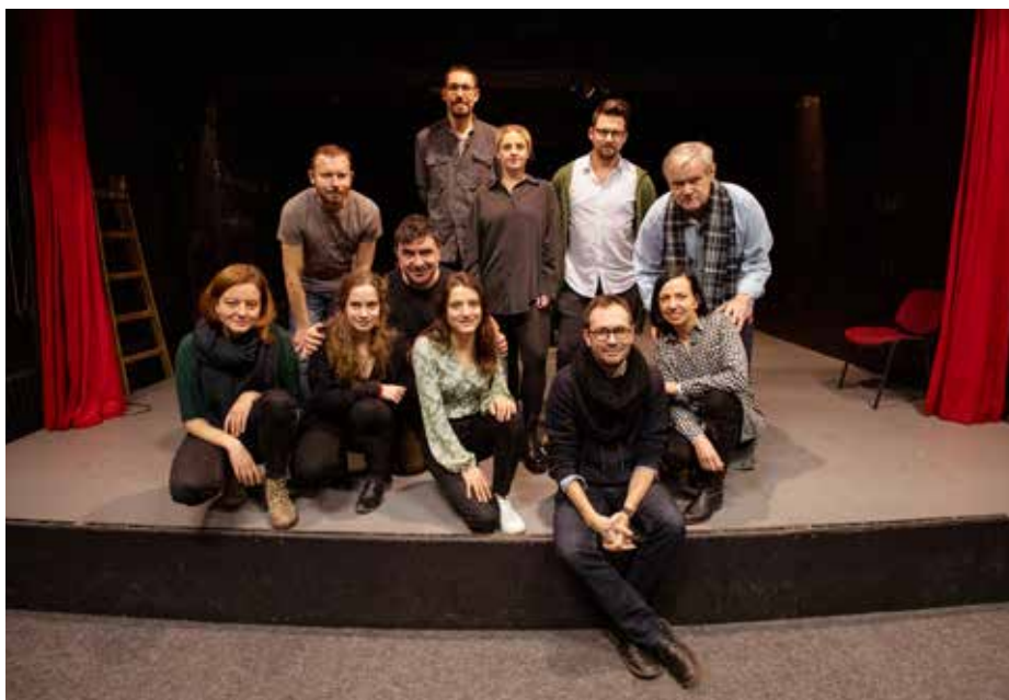
Protagonisté inscenace Teror.