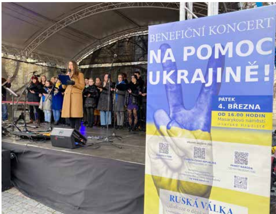
Na Masarykově náměstí se konal koncert na podporu obětem války na Ukrajině.