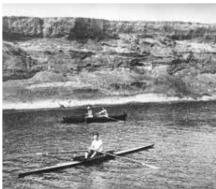
Čertův kút neboli Čerták ve třicátých letech 20. století před regulací řeky Moravy.

Přeložka byla oficiálně zprovozněna 21. prosince 1945. Rameno bylo ve dvou místech přehrazeno tělesem nové přeložky. Vznikly tak tři části slepého ramene. Mezi řekou a dráhou (Čerták I.), za tratí Pod cukrovarem (Čerták II.), jeho západní část byla postupně zavážena a je nazývána Zasypané. Závěrečná jižní část mezi tratí a řekou je pojmenována Vytrávené, protože do ní byly svedeny odpady z výroby cukrovaru a kanalizace z továrny na výrobu barev. Přeložkou