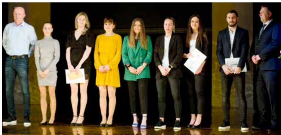
Ocenění sportovci na slavnostním večeru ve Slováckém divadle.