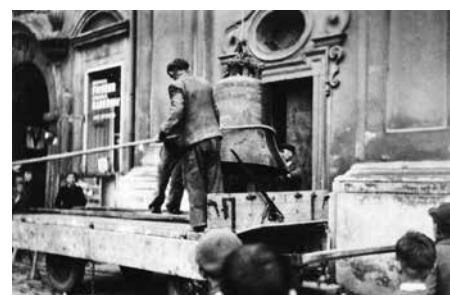
Snímání zvonů z věží farního kostela 7. a 8. dubna 1942.