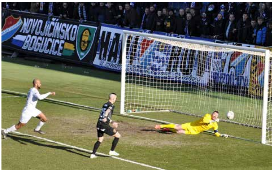
Tato situace mohla zápas s Baníkem 12. března rozhodnout. Nakonec skončilo utkání bez branek.

V sobotu 19. března vyjždělo Slovácko na Bohemians, odkud si odvezlo