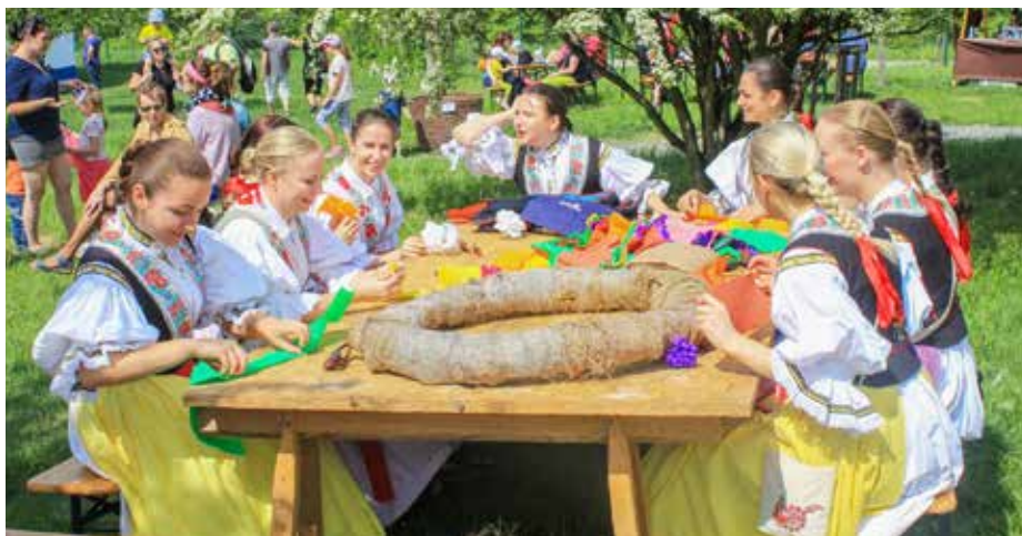
Děvčata zdobí věvec, který bude zavěšený na májce.

Po dvouleté přestávce ožije skanzen Rochus masopustním veselím a Velikonocemi. V programu Od fašanku do Velikonoc v sobotu 9. dubna od 13.00 do 17.00 hodin se rozloučíme s končící zimou a přivítáme přicházející jaro a s ním spojené velikonoční svátky. Členové folklorního souboru Cifra vynesou smrtku, přinesou létečko a předvedou velikonoční obchůzku a ukázkou mečových tanců. Pro děti budou připraveny kreativní dílničky. Děvčata si mohou namalovat vajíčko a třeba se při tom inspirovat u zručných maláreček kraslic. Chlapci se naučí plést pomlázku