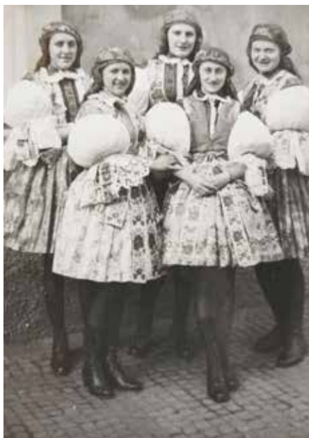
Děvčata z Hradišťanu v mařatickém kroji, padesátá léta.