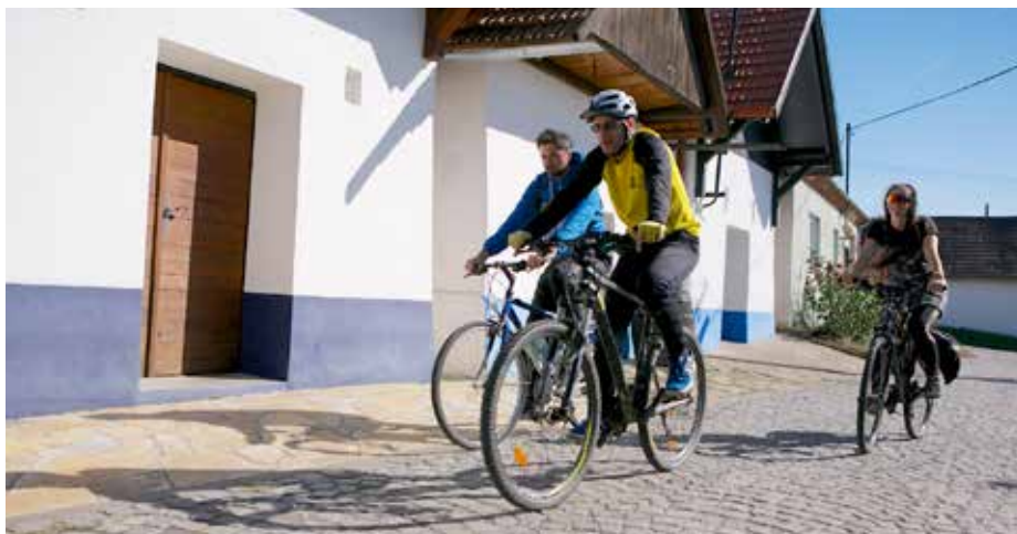
Poznejte krajinu, kde roste víno. Pěšky nebo na kole.

Nová cyklotrasa nese název Stezka Ryzlinku rýnského – Královská. A proč právě královská? Důvodů je hned několik. Ryzlinku rýnskému se přezdívá „Král vín“. Tento přídomek získal jednak díky své ušlechtilosti, jednak kvůli legendám o jeho oblíbenosti