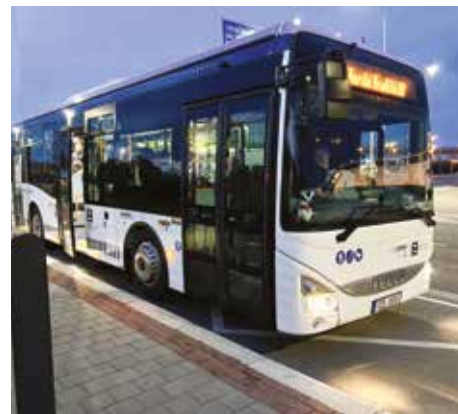
Začátkem března vyjely autobusy nové linky 300.

V přípravě je vybudování dalších nových zastávek – třeba v Rybárnách či na Tyršově náměstí, jiné budou v první fázi provizorní