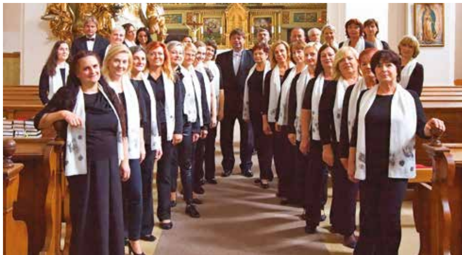
Smišený pěvecký sbor Svatoopluk v současnosti.