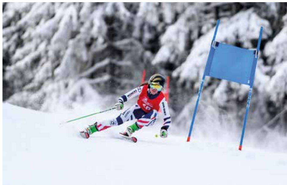
Mladá závodnice v akci.