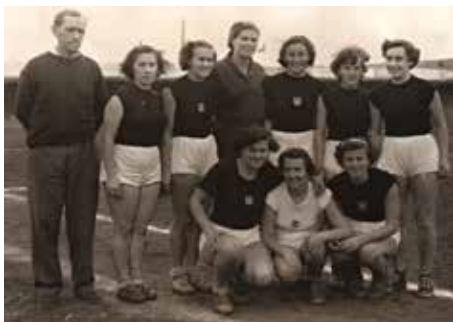
Trenér mistrů republiky v házené v roce 1949.