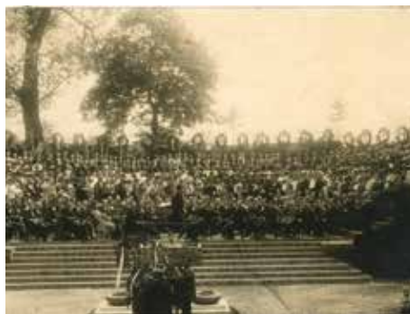
Účinkující Smetanovy tryzny.