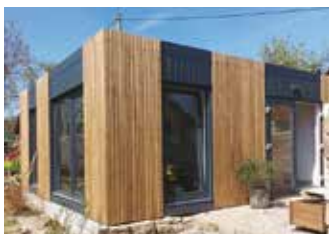
Nový showroom, Provodov 14