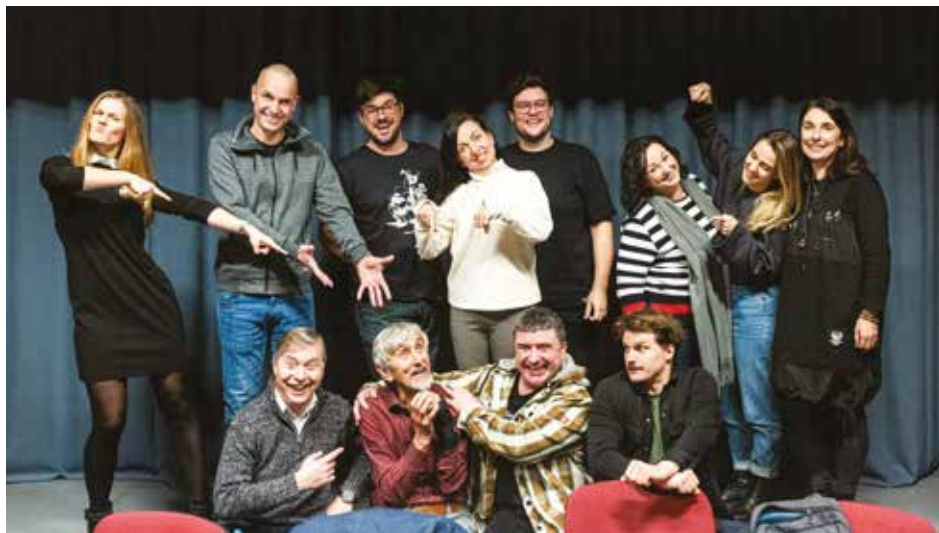
Realizační tým inscenace Hostina dravců .

Psychologické drama je 99. režii emeritního ředitele Slováckého divadla